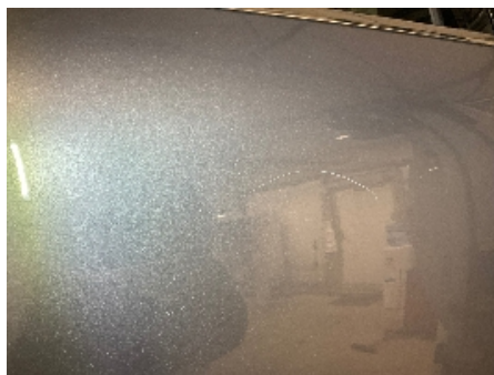
5. Lakk / karosseri utvendig