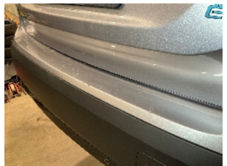
6. Lakk / karosseri utvendig