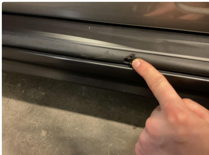
1.2 Løse/skadede lister