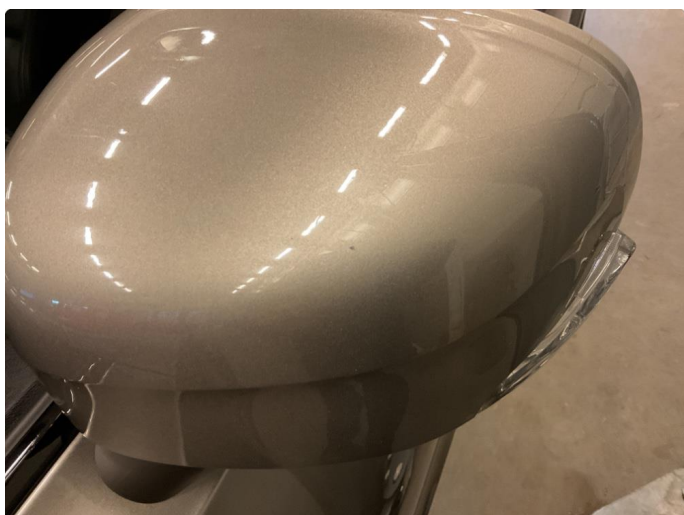
1.3 Øvrige feil