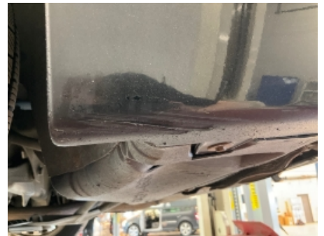
30. Karosseri generelt