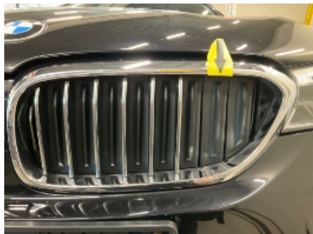
11. Karosseri generelt