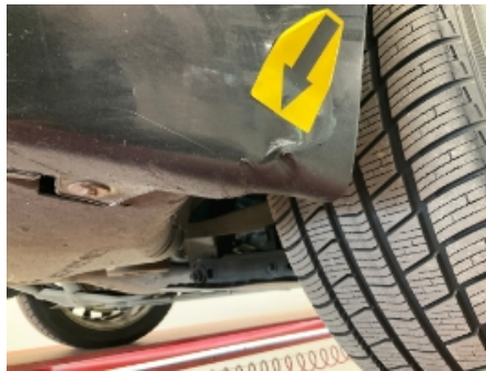
29. Karosseri generelt