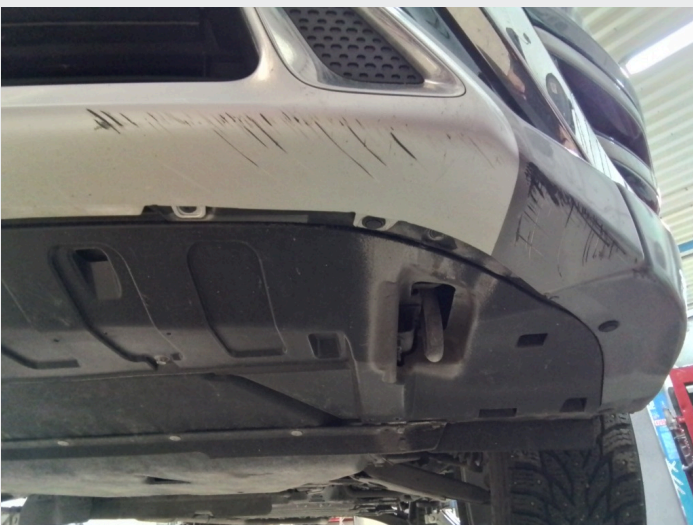
2.8 Dype riper underkant av fremre støtfanger