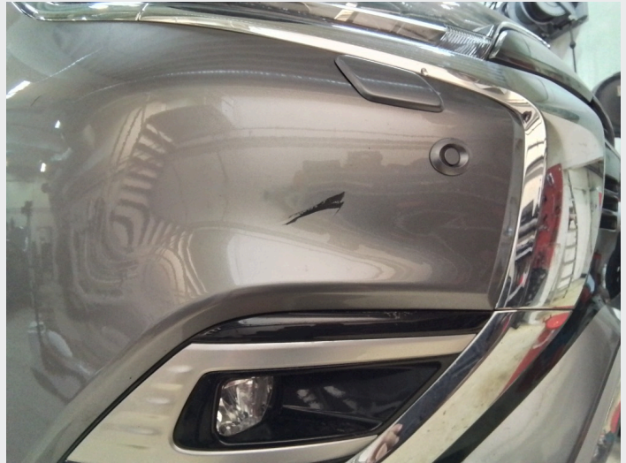
2.8 Dype riper underkant av fremre støtfanger