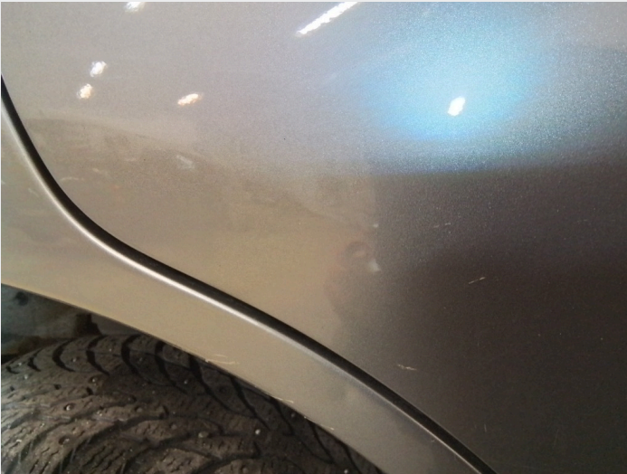
2.5 Bulk I høyre bakdør