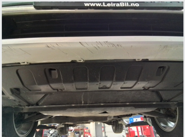
2.8 Dype riper underkant av fremre støtfanger