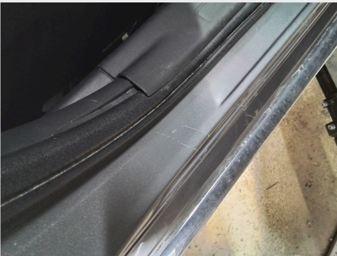
2.5 Riper innsteg høyre framdør