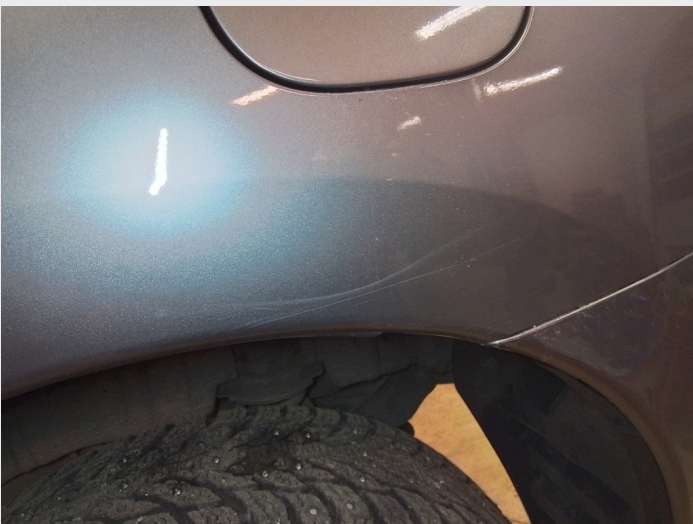
2.7 Riper venstre bakdør og bakskjerm