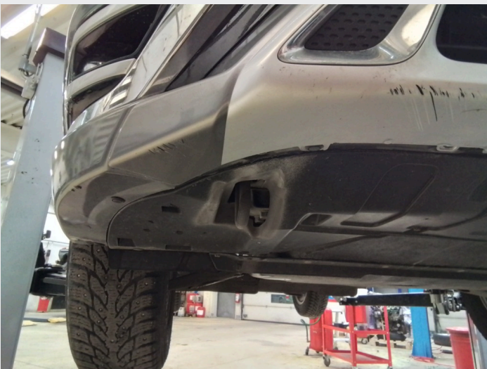
2.8 Dype riper underkant av fremre støtfanger