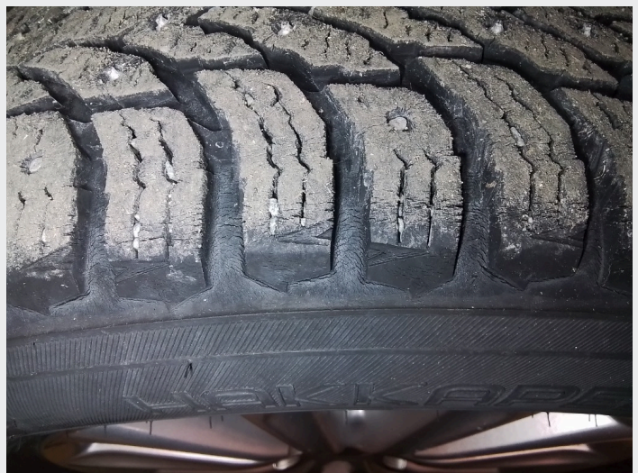
2.17 Sprekker I kant av rullemønster vinterdekk