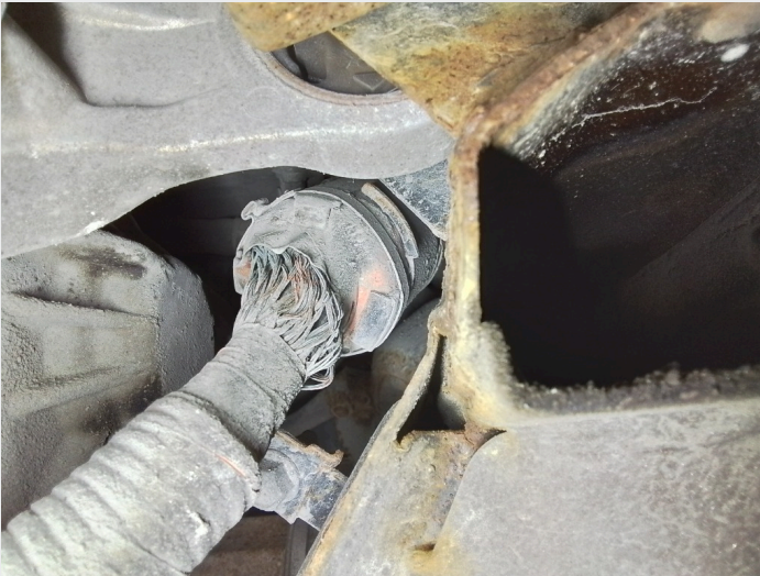
5.7 Irr på jordingskabel til bakre elmotor