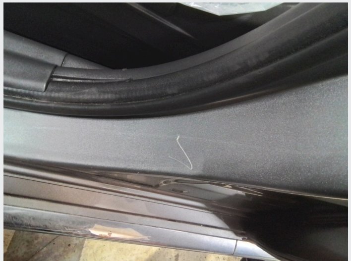
2.5 Ripe innsteg førerdør