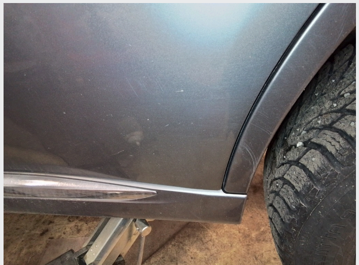
2.7 Riper venstre bakdør og bakskjerm