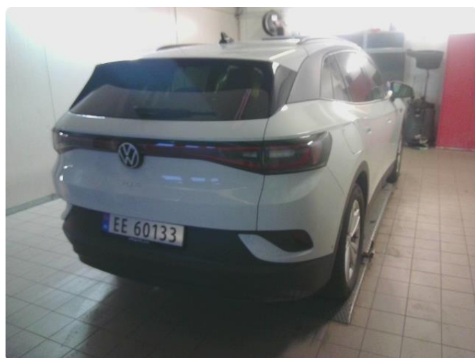
2.1 Bilder av bil