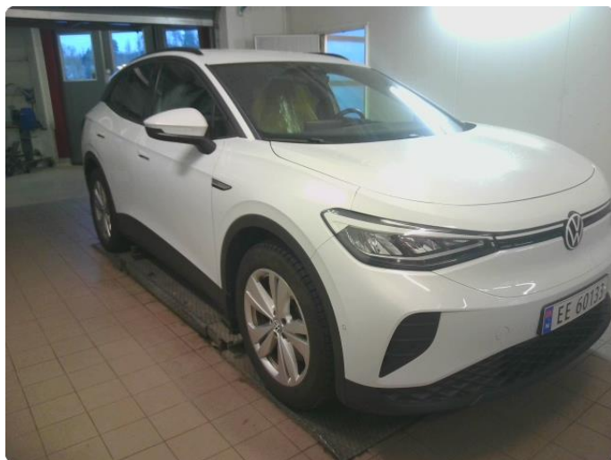
2.1 Bilder av bil