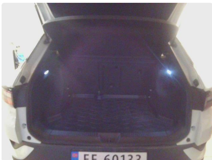
2.1 Bilder av bil