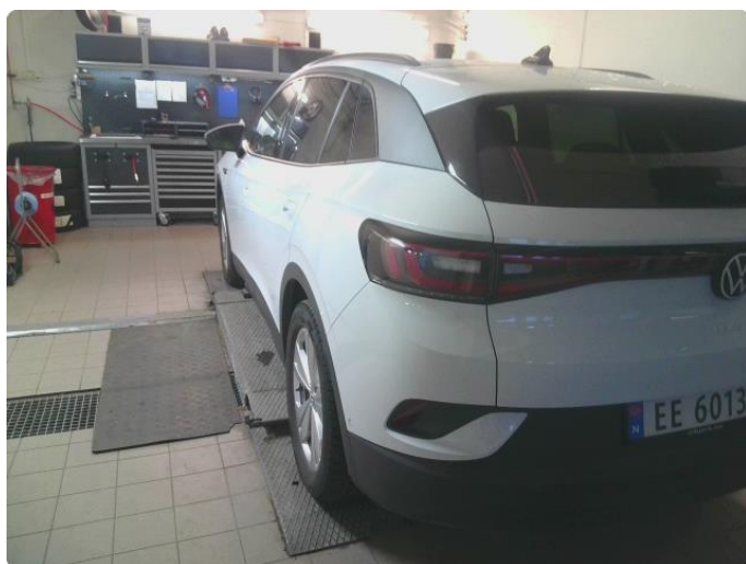
2.1 Bilder av bil