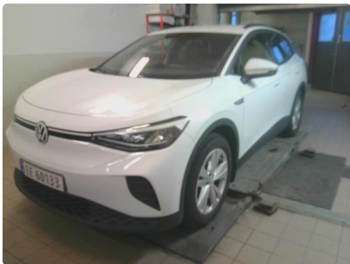
2.1 Bilder av bil