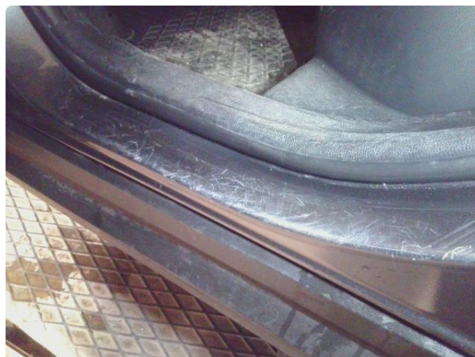
1.2 Slitt innsteg