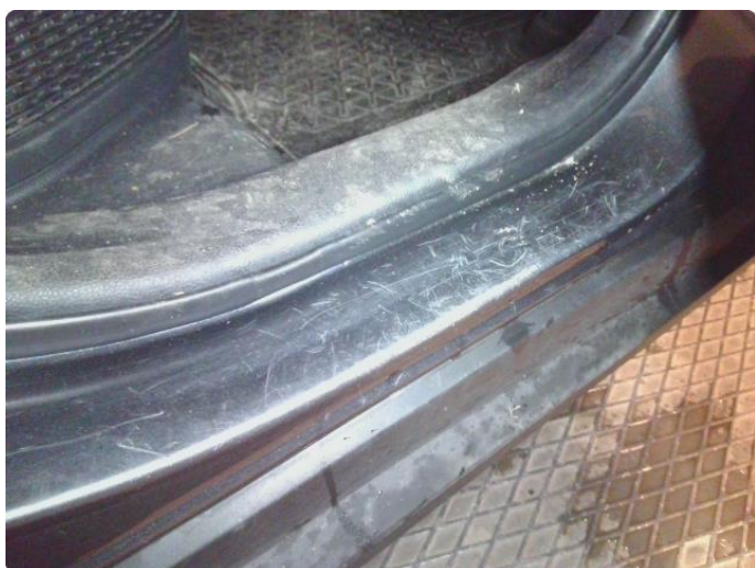
1.3 Slitt innsteg