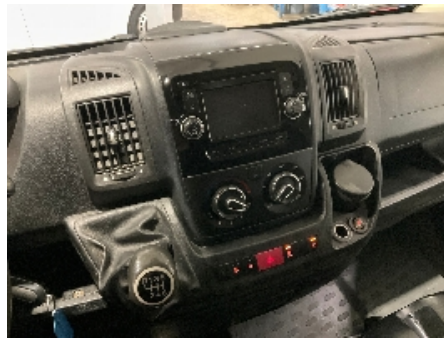
17. Instrument belysning