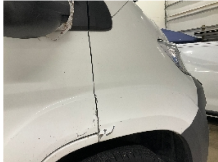
8. Lakk / karosseri utvendig