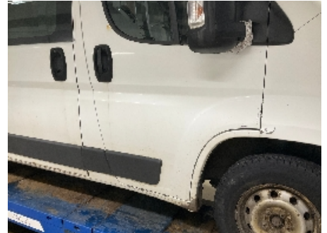
9. Lakk / karosseri utvendig