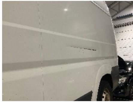
14. Lakk / karosseri utvendig