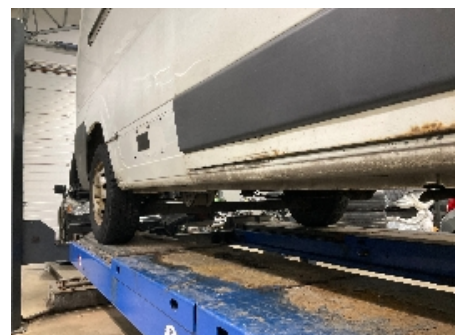
12. Lakk / karosseri utvendig