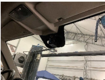
4. Innvendig speil