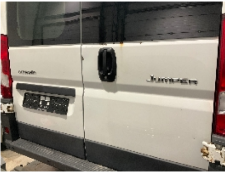
13. Lakk / karosseri utvendig