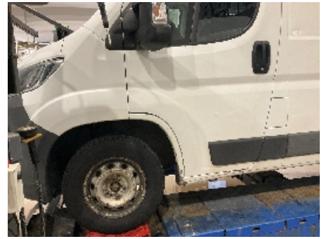
15. Lakk / karosseri utvendig