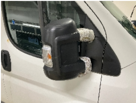
1. Utvendig speil