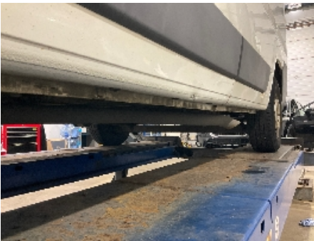
16. Lakk / karosseri utvendig