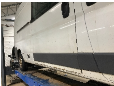
10. Lakk / karosseri utvendig