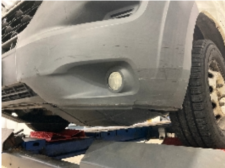
7. Lakk / karosseri utvendig