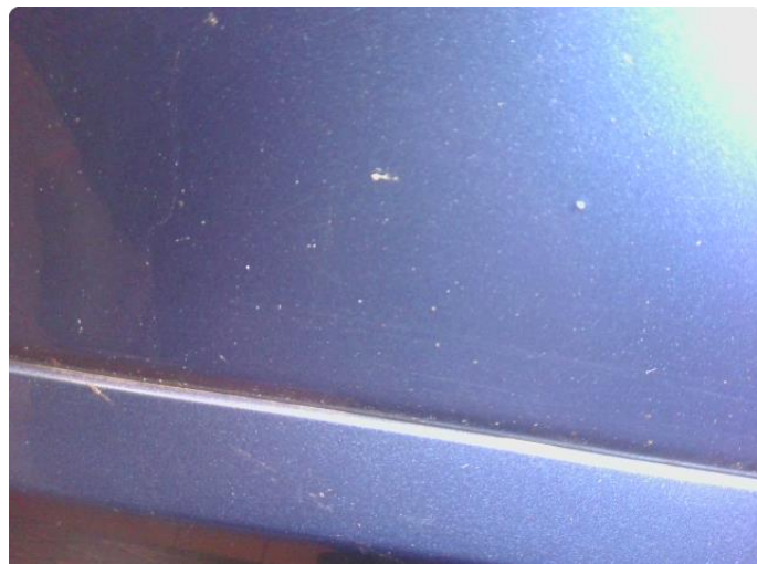
1.4 Noe steinsprut