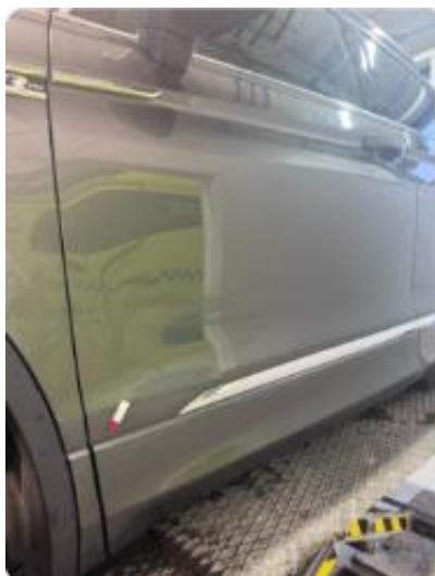
1.2 Steinsprut med korrosjon venstre fordør.