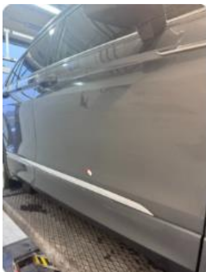
1.3 Noe riper høyre fordør.