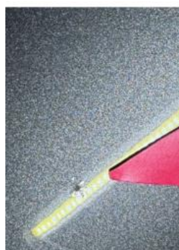
1.4 Steinsprut med korrosjon.