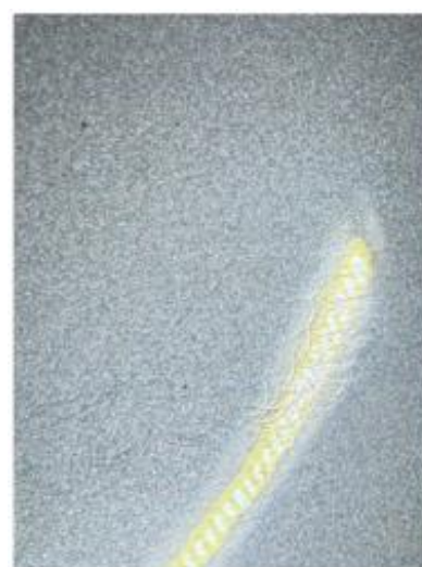
1.3 Noe riper høyre fordør.