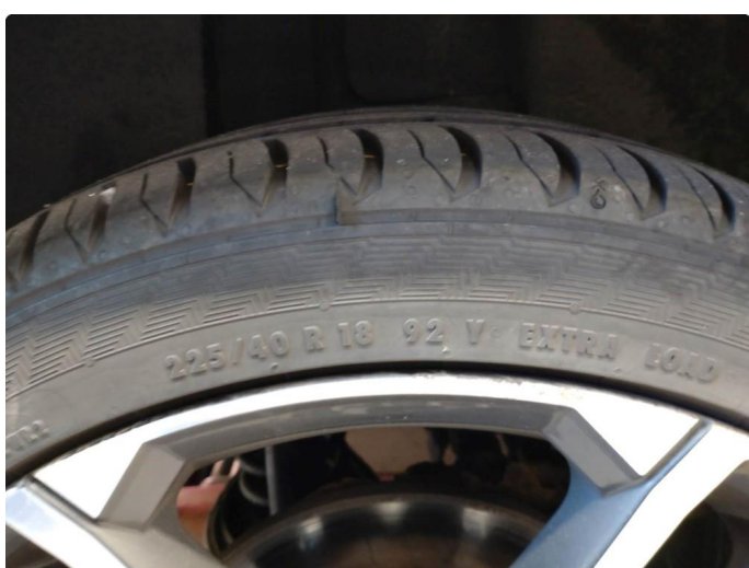
1.5 Kantkjørt felg