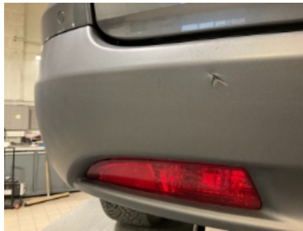
41. Lakk / karosseri utvendig