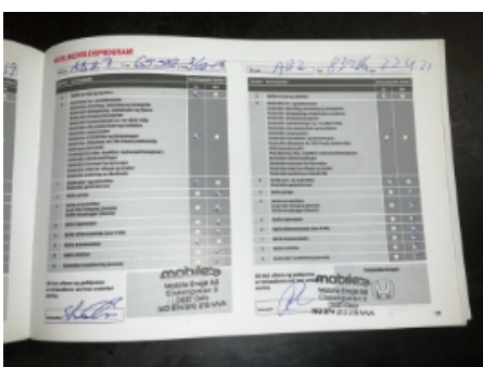
58. Service/ Dokum.