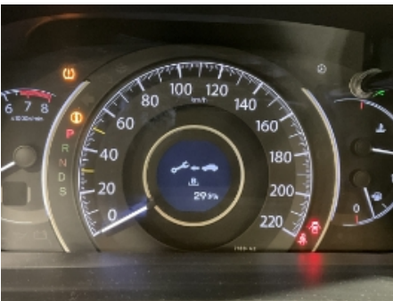
19. Service/ Dokum.