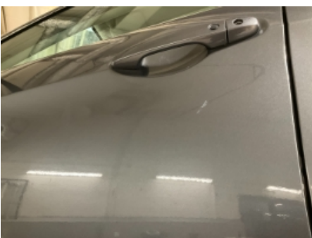
34. Lakk / karosseri utvendig