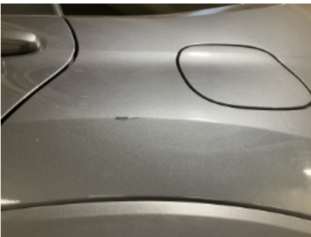
31. Lakk / karosseri utvendig