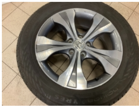
50. Ekstra hjulsett