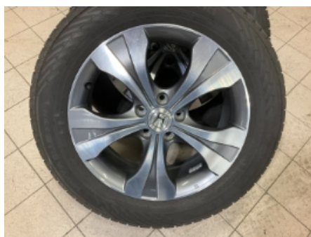
47. Ekstra hjulsett