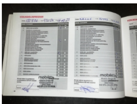
59. Service/ Dokum.