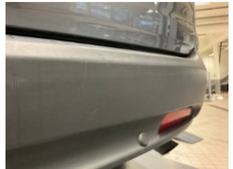
42. Lakk / karosseri utvendig