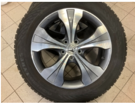
49. Ekstra hjulsett