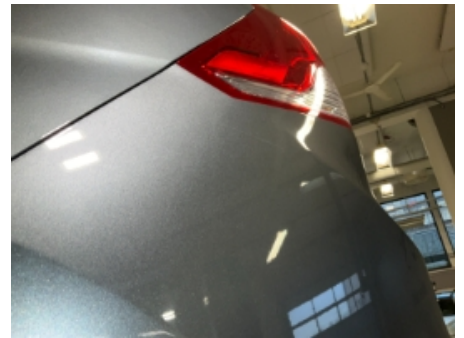
30. Lakk / karosseri utvendig