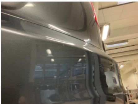
43. Lakk / karosseri utvendig