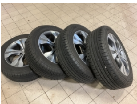
46. Ekstra hjulsett