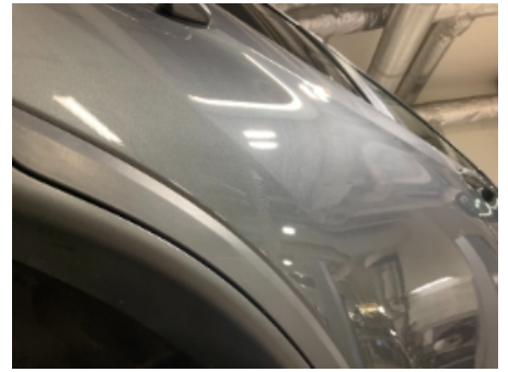
39. Lakk / karosseri utvendig