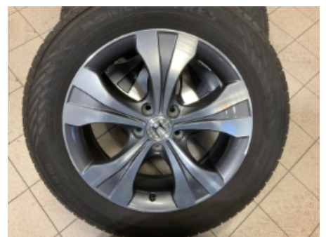
48. Ekstra hjulsett