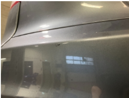
40. Lakk / karosseri utvendig