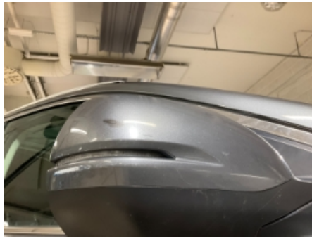
38. Lakk / karosseri utvendig