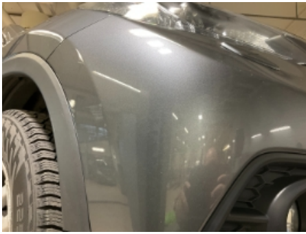
37. Lakk / karosseri utvendig