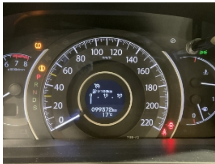
20. Service/ Dokum.