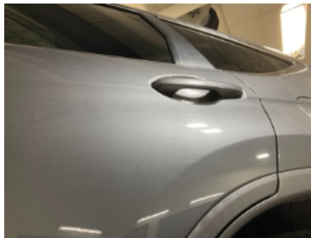
32. Lakk / karosseri utvendig