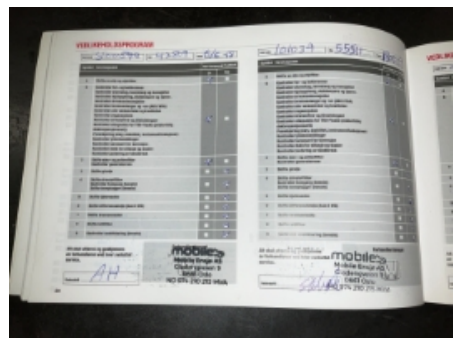
57. Service/ Dokum.