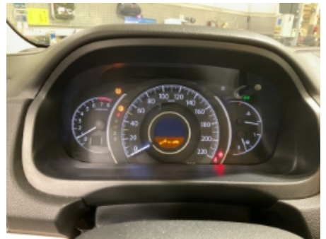
18. Varsellamper utvidet