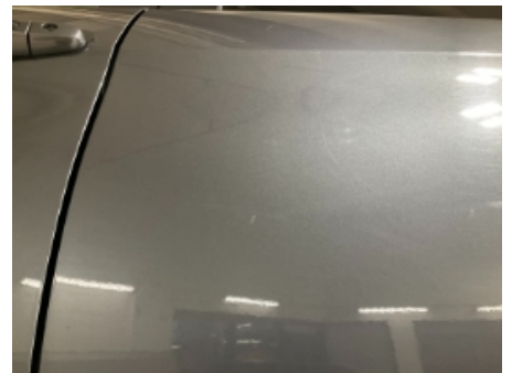
33. Lakk / karosseri utvendig