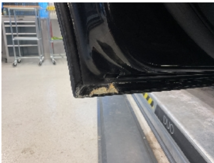
19. Lakk / karosseri utvendig