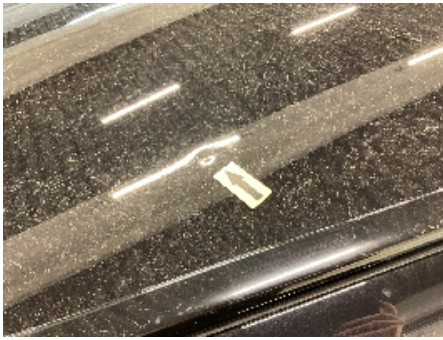
13. Lakk / karosseri utvendig