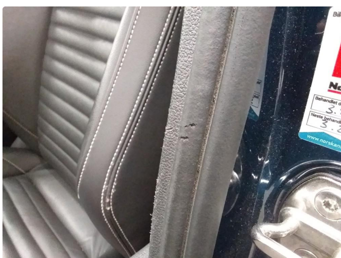
1.2 Pakning skadet