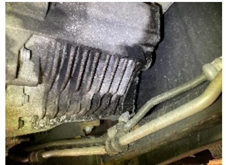
30. Utvendig tilstand motor