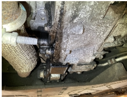
29. Utvendig tilstand motor