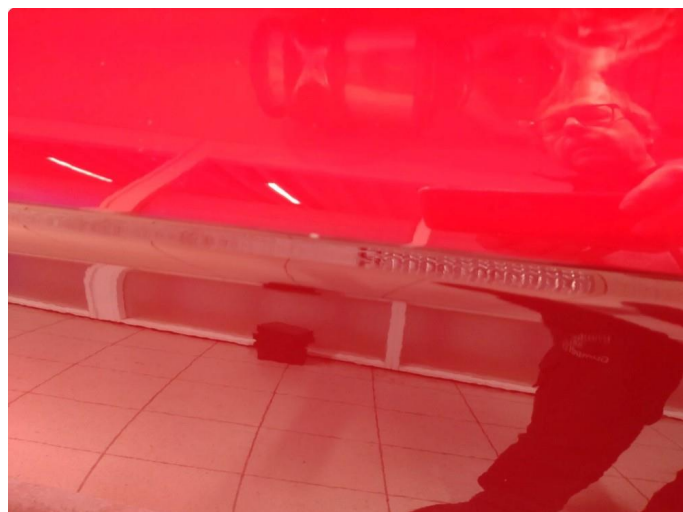
1.2 Ripe ned til grunning