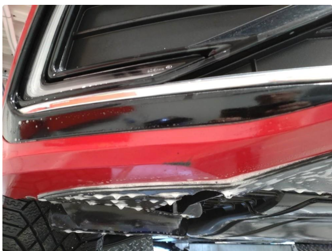
1.4 Skrubbskader underkant