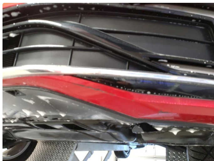
1.4 Skrubbskader underkant