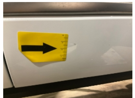
48. Karosseri generelt