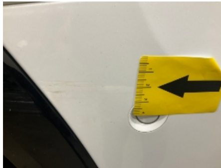
44. Støtfanger bak