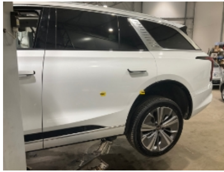
38. Venstre bakhjør