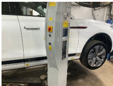
47. Karosseri generelt