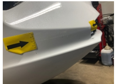
33. Støtfanger foran