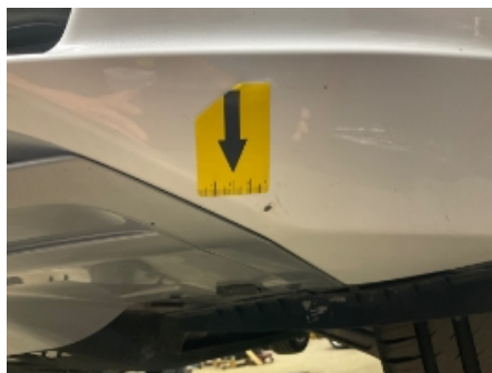
35. Støtfanger foran