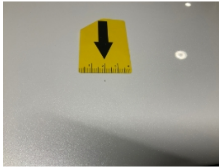
50. Karosseri generelt