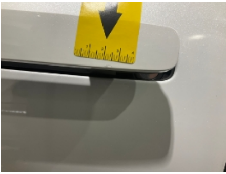
37. Venstre fordør