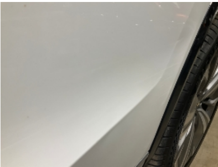
40. Venstre bakhjør