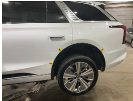
41. Venstre bakskjerm