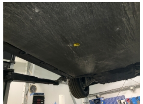
57. Utv. tilstand fremdriftsbatteri elbil/hybrid