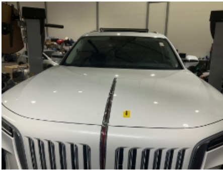
49. Karosseri generelt