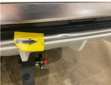
46. Støtfanger bak