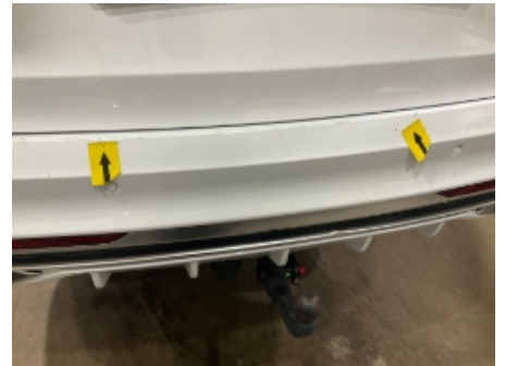
45. Støtfanger bak