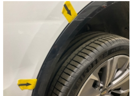
42. Venstre bakskjerm