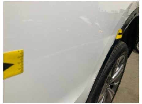
39. Venstre bakhjør