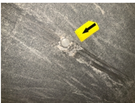
58. Utv. tilstand fremdriftsbatteri elbil/hybrid