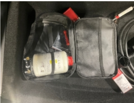
28. Reservehjul / dekkreparasjonssett