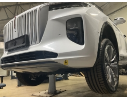
34. Støtfanger foran