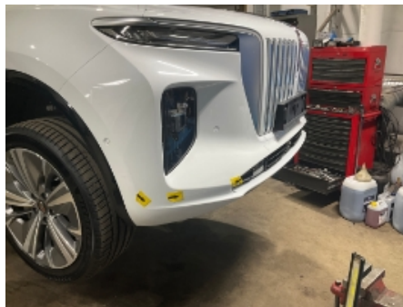
32. Støtfanger foran