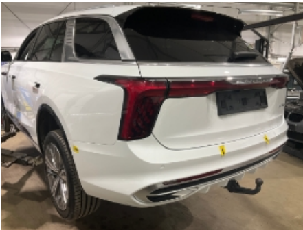
43. Støtfanger bak