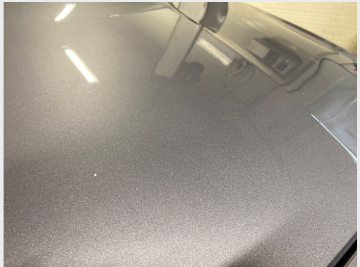
2.3 Steinsprut panser