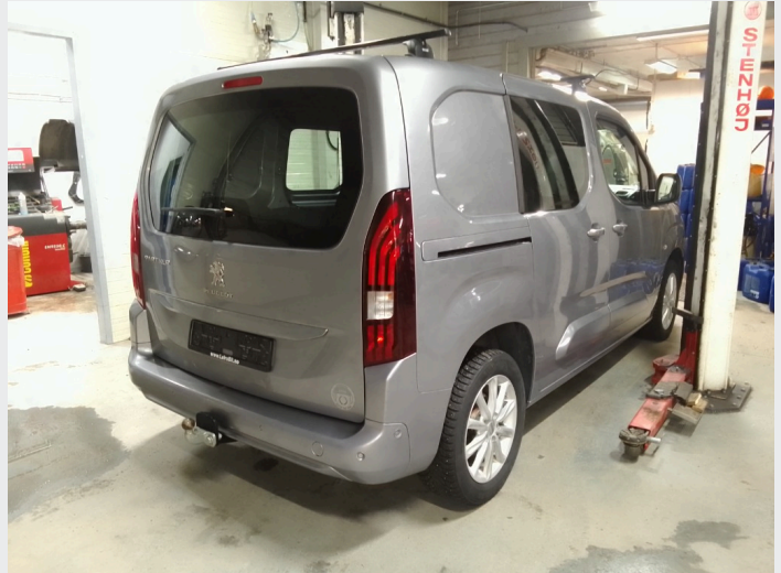
2.1 Oversiktsbilder av bilen