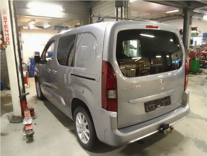
2.1 Oversiktsbilder av bilen