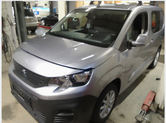
2.1 Oversiktsbilder av bilen