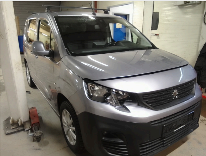
2.1 Oversiktsbilder av bilen