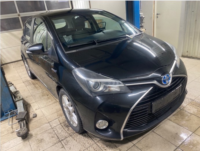
2.1 oversiktsbilder av bilen