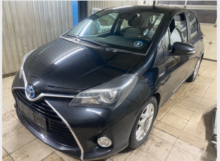
2.1 oversiktsbilder av bilen