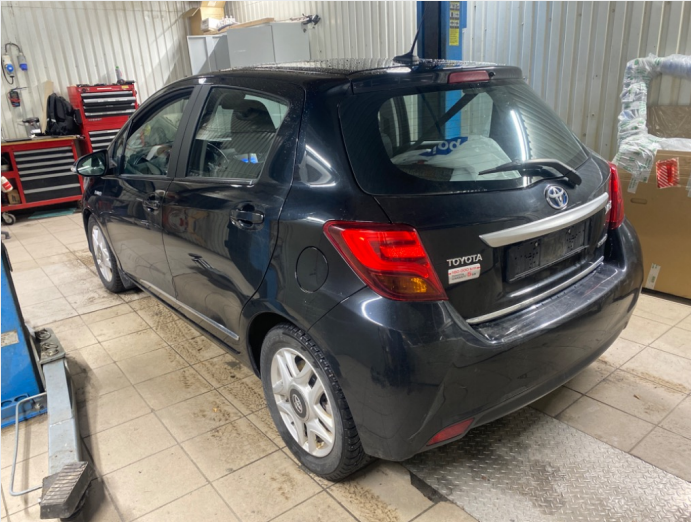
2.1 oversiktsbilder av bilen