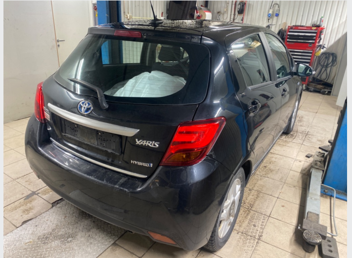
2.1 oversiktsbilder av bilen