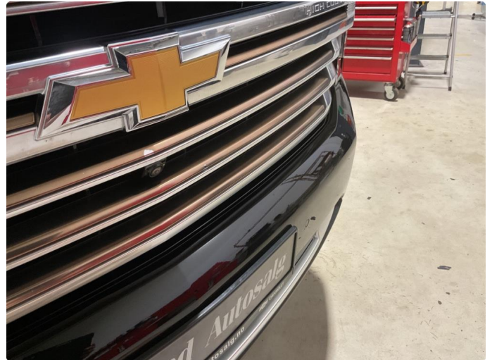
1.2 Lakk flasser