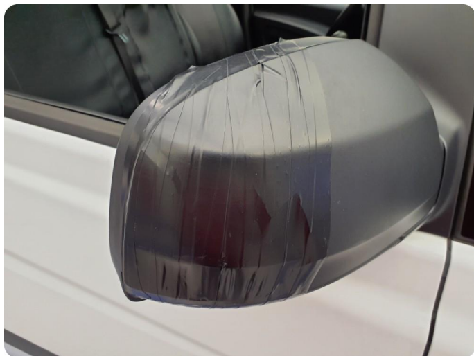
3.2 Speilhus skadet Må kontrolleres for og vite hva som må byttes