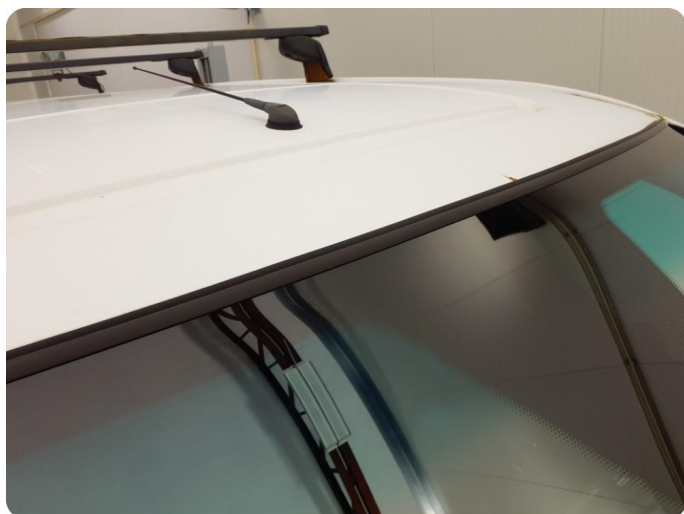
3.1 Øvrige feil Generelt mye riper, bulker, rust og noe steinsprut på hele bilen