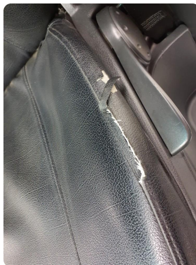
6.2 Øvrige feil Slitt setetrekk, ikke kontrollert seter under trekk.