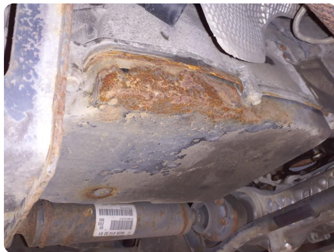
5.1 Øvrige feil Rust bunnpanne