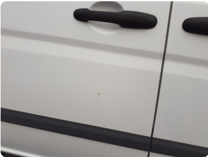
3.1 Øvrige feil Generelt mye riper, bulker, rust og noe steinsprut på hele bilen