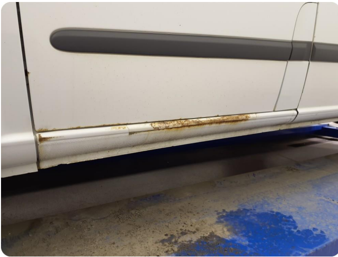
3.1 Øvrige feil Generelt mye riper, bulker, rust og noe steinsprut på hele bilen