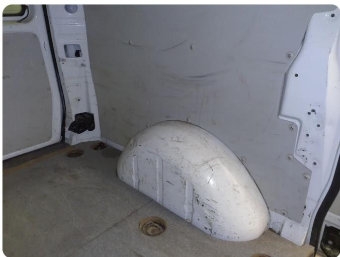
6.6 Øvrige feil En del merker, riper, bulker i hele varerom inkl bakluke