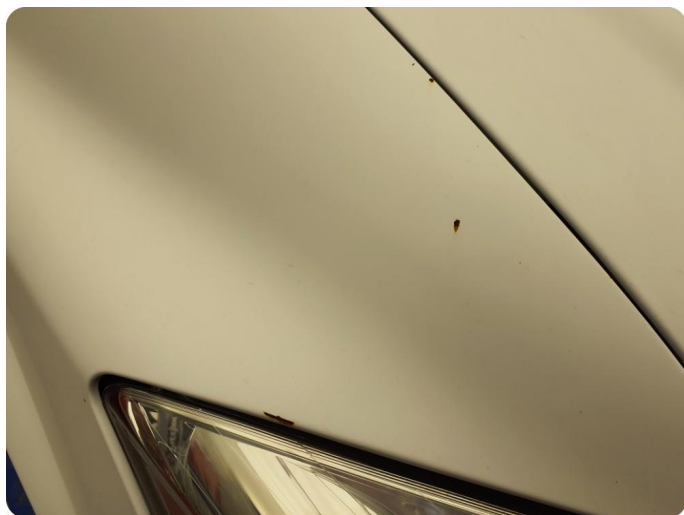
3.1 Øvrige feil Generelt mye riper, bulker, rust og noe steinsprut på hele bilen