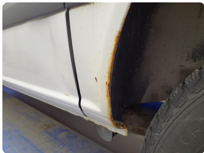
3.1 Øvrige feil Generelt mye riper, bulker, rust og noe steinsprut på hele bilen