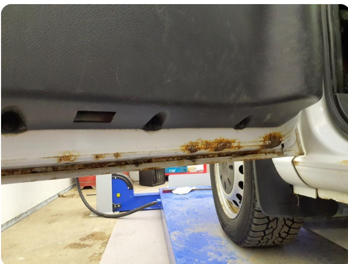
3.1 Øvrige feil Generelt mye riper, bulker, rust og noe steinsprut på hele bilen