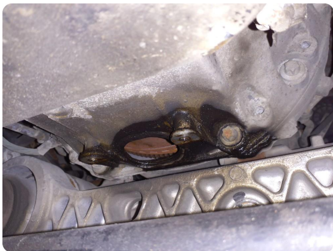
4.2 Øvrige feil Svetting mellom motor og gir. Må kontrolleres