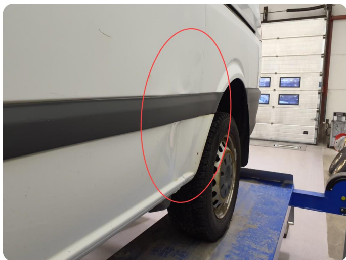
3.1 Øvrige feil Generelt mye riper, bulker, rust og noe steinsprut på hele bilen