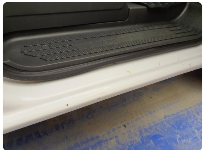
3.1 Øvrige feil Generelt mye riper, bulker, rust og noe steinsprut på hele bilen