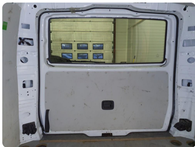
6.6 Øvrige feil En del merker, riper, bulker i hele varerom inkl bakluke