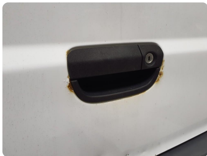
3.1 Øvrige feil Generelt mye riper, bulker, rust og noe steinsprut på hele bilen