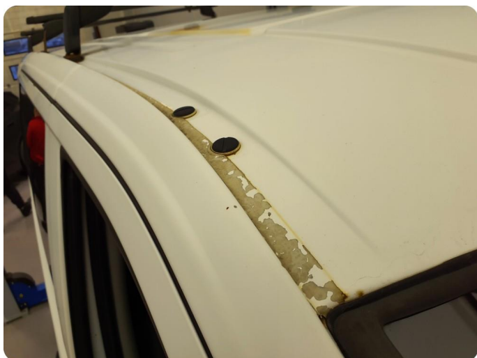
3.1 Øvrige feil Generelt mye riper, bulker, rust og noe steinsprut på hele bilen