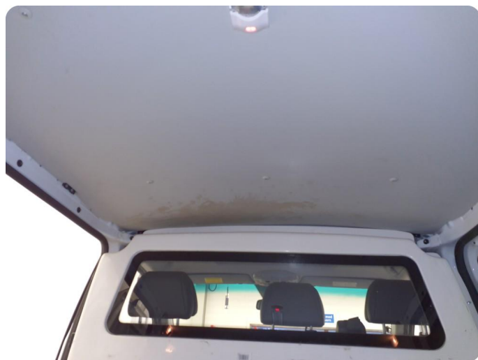
6.6 Øvrige feil En del merker, riper, bulker i hele varerom inkl bakluke