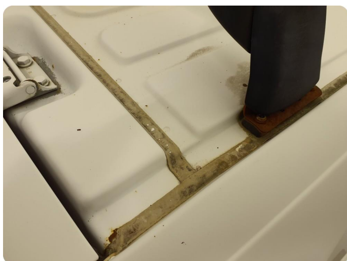
3.1 Øvrige feil Generelt mye riper, bulker, rust og noe steinsprut på hele bilen