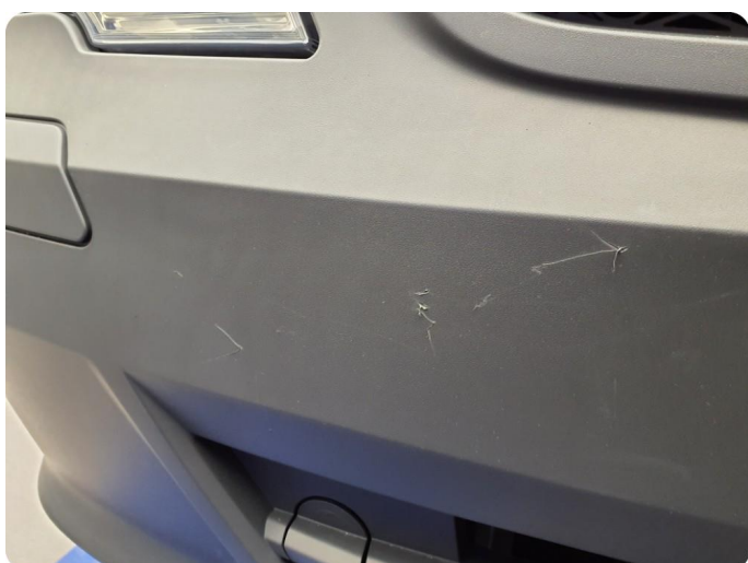
3.1 Øvrige feil Generelt mye riper, bulker, rust og noe steinsprut på hele bilen