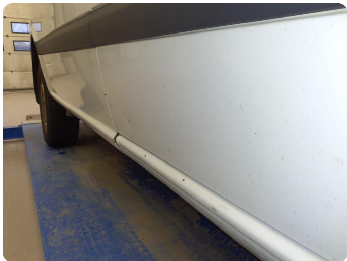
3.1 Øvrige feil Generelt mye riper, bulker, rust og noe steinsprut på hele bilen