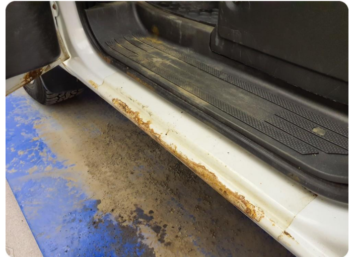
3.1 Øvrige feil Generelt mye riper, bulker, rust og noe steinsprut på hele bilen