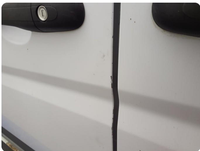
3.1 Øvrige feil Generelt mye riper, bulker, rust og noe steinsprut på hele bilen