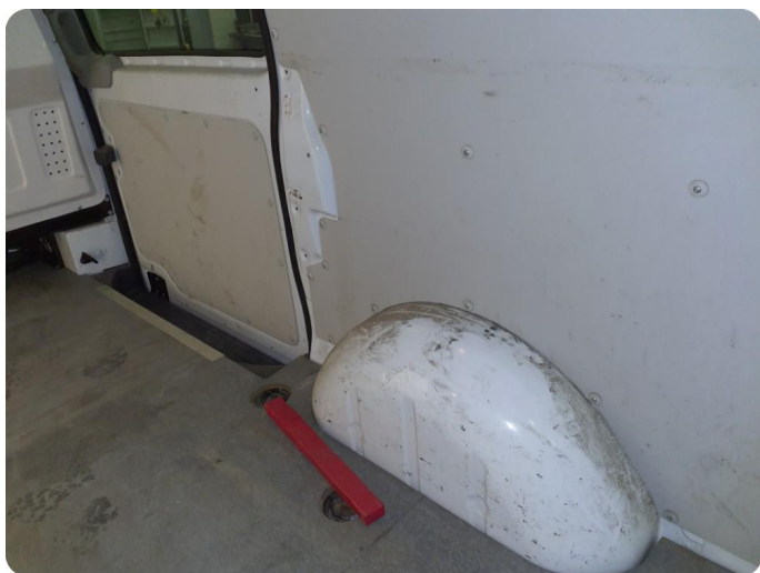
6.6 Øvrige feil En del merker, riper, bulker i hele varerom inkl bakluke