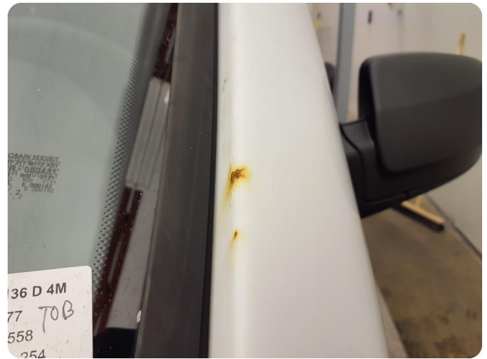
3.1 Øvrige feil Generelt mye riper, bulker, rust og noe steinsprut på hele bilen