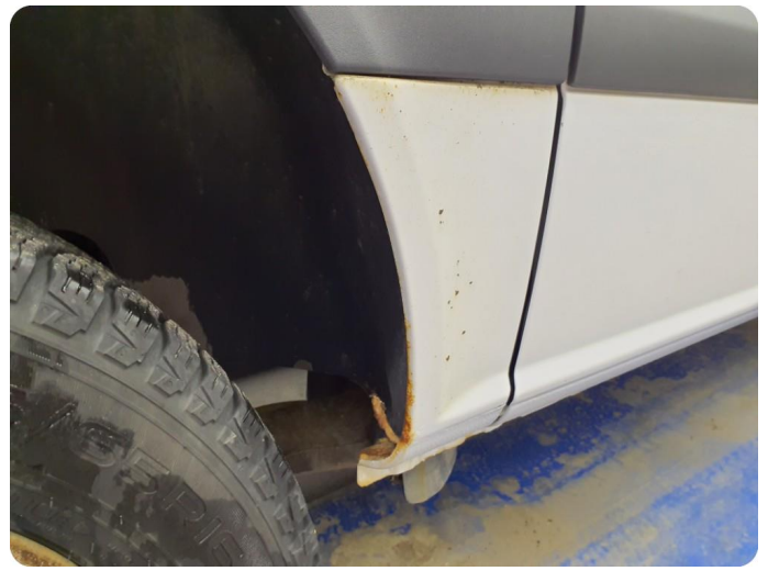
3.1 Øvrige feil Generelt mye riper, bulker, rust og noe steinsprut på hele bilen