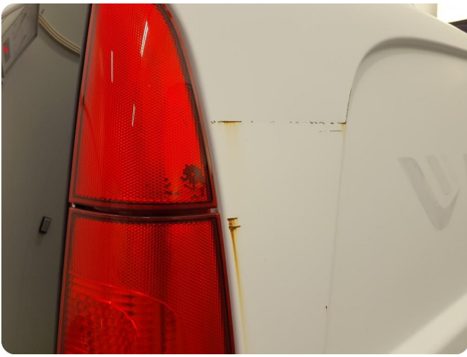
3.1 Øvrige feil Generelt mye riper, bulker, rust og noe steinsprut på hele bilen