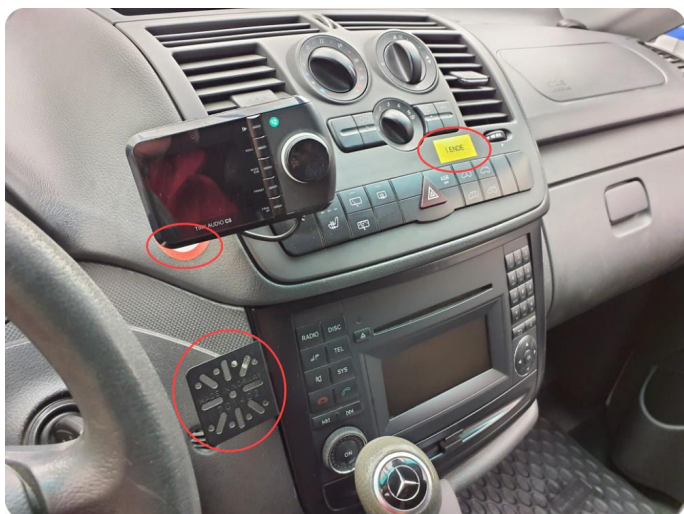
6.1 Øvrige feil Fjerne klistremerker og holder