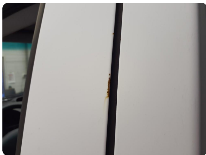
3.1 Øvrige feil Generelt mye riper, bulker, rust og noe steinsprut på hele bilen