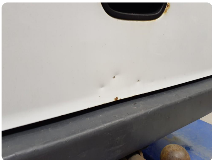
3.1 Øvrige feil Generelt mye riper, bulker, rust og noe steinsprut på hele bilen