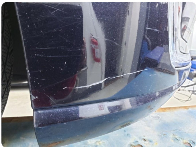
1.5 Ripe(r) ned til grunning