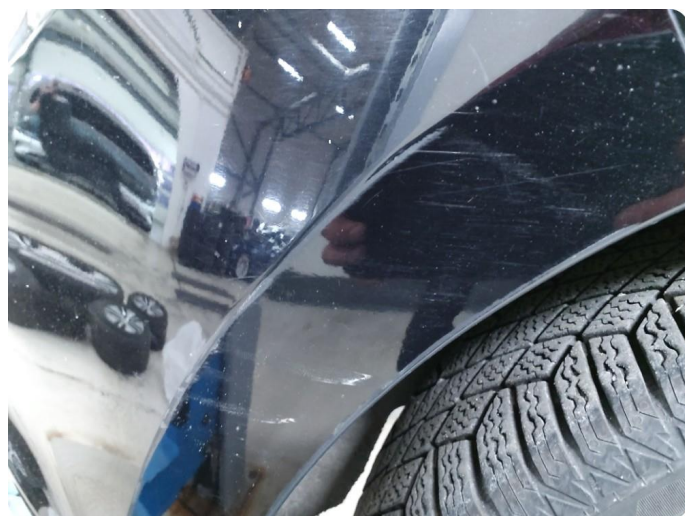
1.7 Ripe(r) ned til grunning