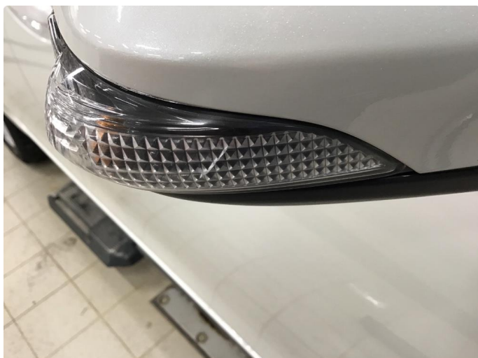
1.1 Blinklys sprukket/krakelert