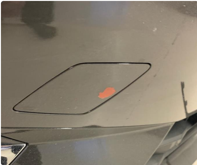
1.4 Lakk flasser av på tauekrokdeksel på støtfanger foran. Blir penslet.