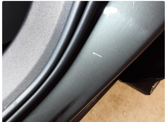
1.3 Liten bulk og lakksår.