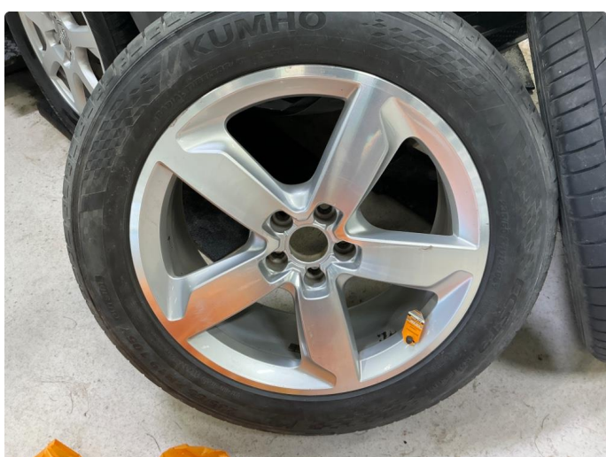
1.3 Kosmetisk skade på sommerfelger.