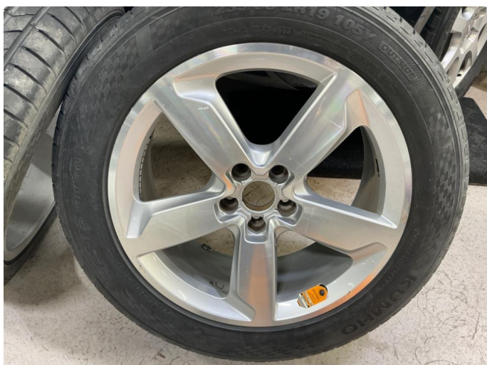
1.3 Kosmetisk skade på sommerfelger.