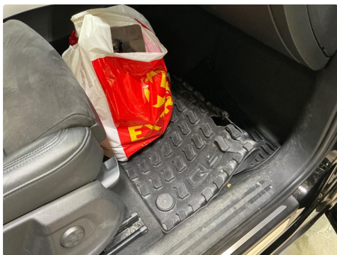
4.1 Slitte gummimatter foran