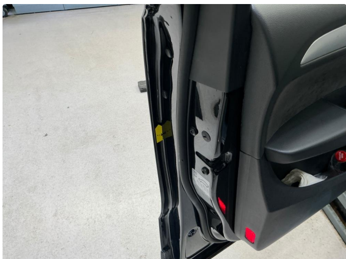
1.1 Blære innv. Fals v.fd.