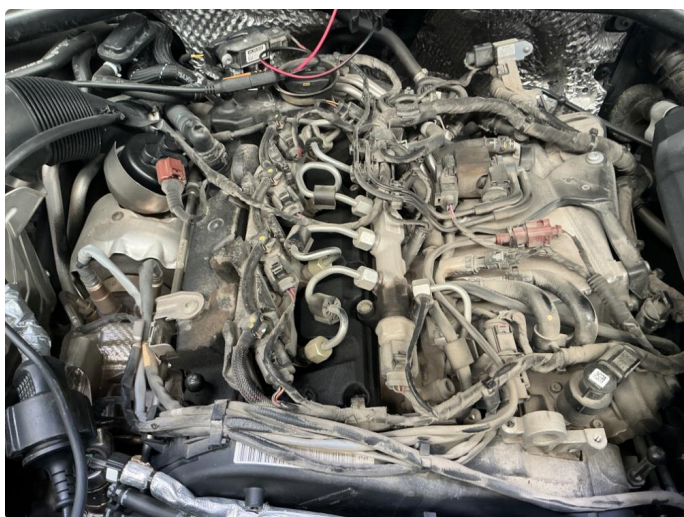
2.1 Svetting toppdeksel / dyser.