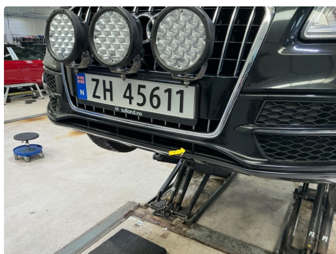
1.4 Liten skade på nedre grill foran.