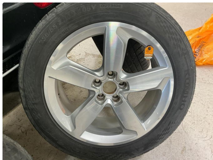
1.3 Kosmetisk skade på sommerfelger.