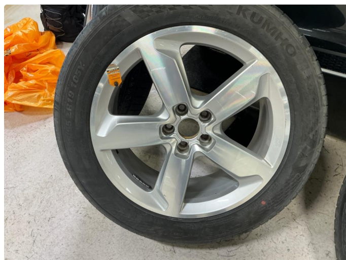
1.3 Kosmetisk skade på sommerfelger.