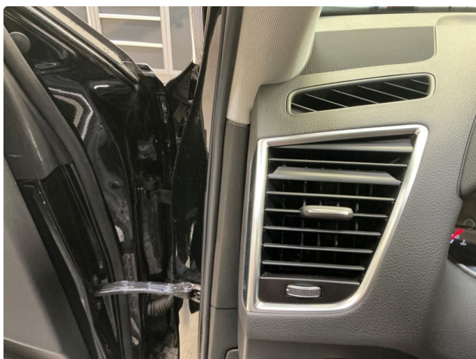
4.2 Defekt luftdyse v.s