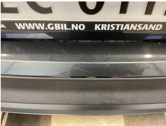
1.3 Noe riper