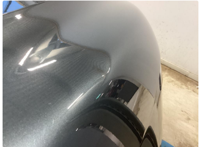
1.2 Liten bulk