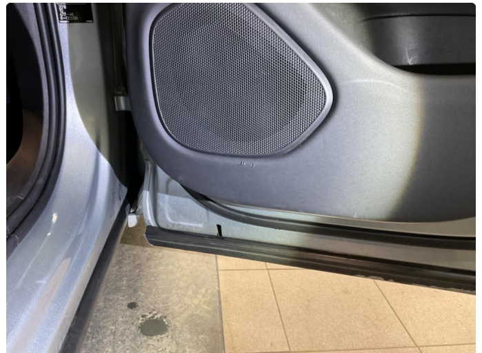
1.3 Noen bruksmerker på dørtrekk