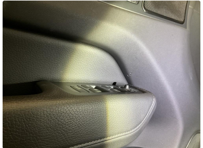
1.1 Noen bruksmerker på dørtrekk