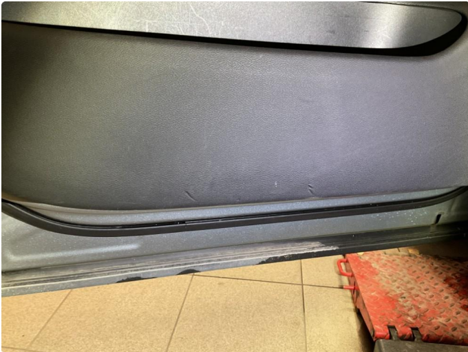
1.1 Noen bruksmerker på dørtrekk