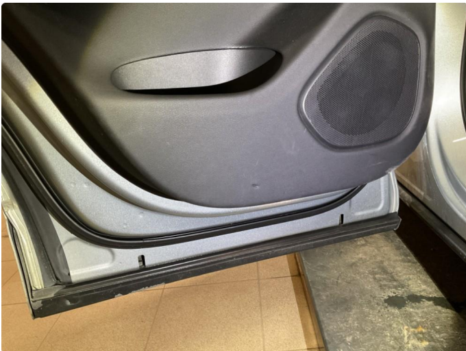
1.2 Noen bruksmerker på dørtrekk