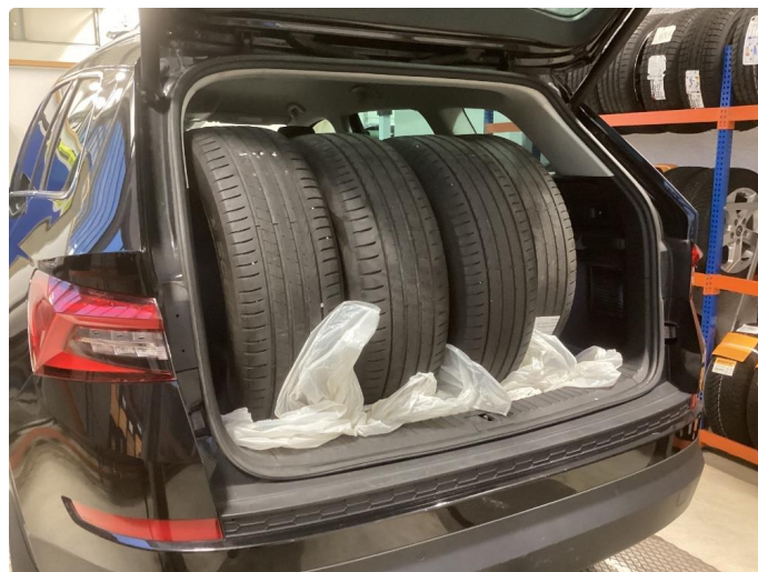
2.1 Øvrig opplysninger