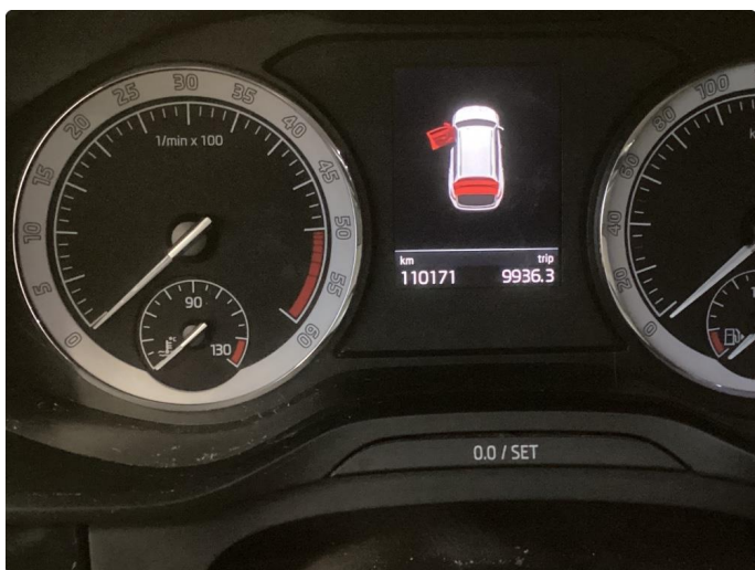
2.1 Øvrig opplysninger