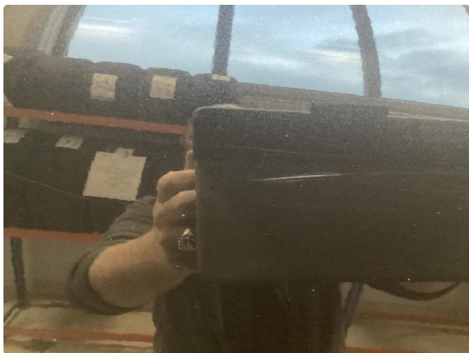
1.2 Noe riper og liten p-bulk venstrebakskjerm