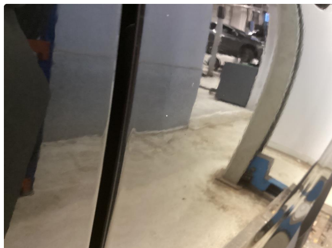
1.1 Høyre bakskjerm og for/bakdør er omlakkert