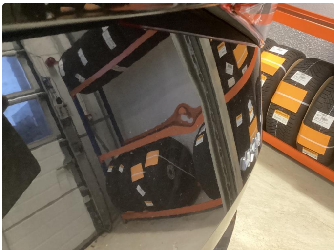
1.3 Ripe og p-bulk bakluke