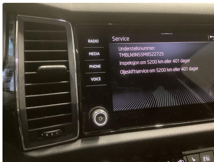
2.1 Øvrig opplysninger