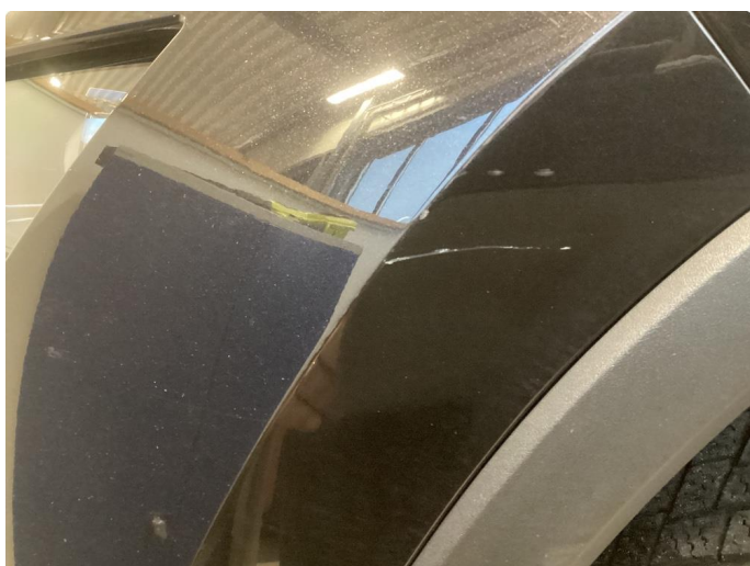
1.2 Noe riper og liten p-bulk venstrebakskjerm