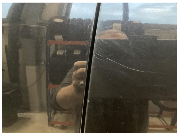
1.2 Noe riper og liten p-bulk venstrebakskjerm