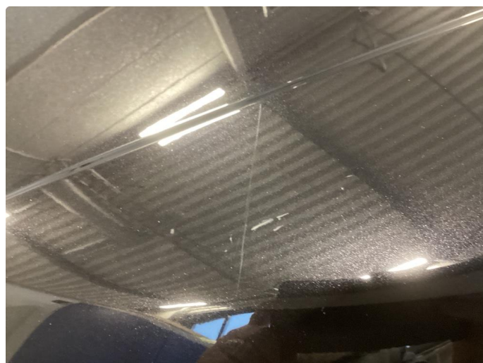
1.2 Noe riper og liten p-bulk venstrebakskjerm