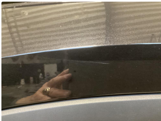
1.2 Noe riper og liten p-bulk venstrebakskjerm