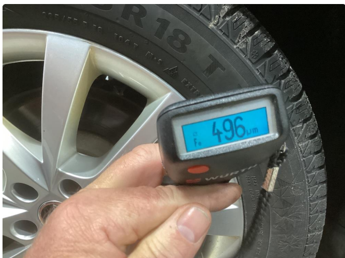
1.1 Høyre bakskjerm og for/bakdør er omlakkert