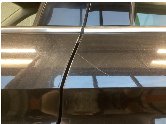
1.2 Noe riper og liten p-bulk venstrebakskjerm