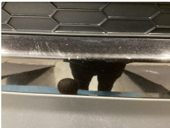
1.4 Noe knast og riper i fanger bak