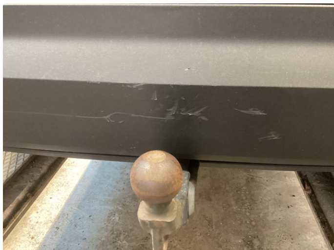
1.4 Noe knast og riper i fanger bak