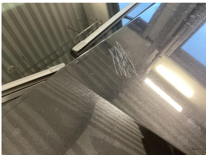
1.2 Noe riper og liten p-bulk venstrebakskjerm