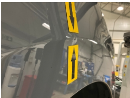
10. Høyre forskjerm