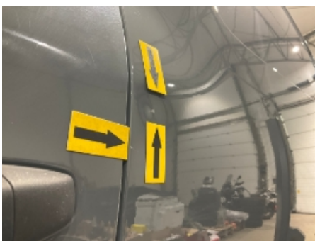
4. Venstre bakskjerm