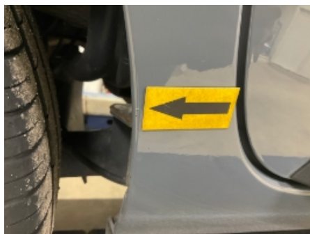
8. Karosseri generelt