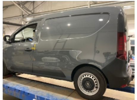
3. Venstre bakskjerm