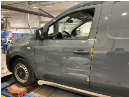
1. Venstre fordør