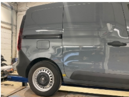
7. Karosseri generelt