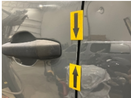
2. Venstre fordør