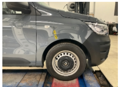
9. Høyre forskjerm