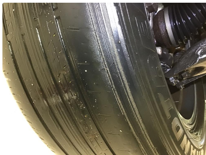
1.4 Dekkskade sommerhjul