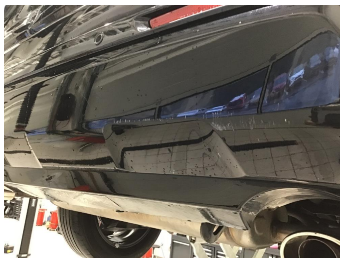
1.5 Ripe(r) ned til grunning