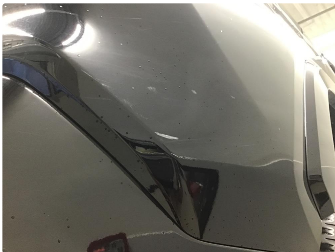
1.5 Ripe(r) ned til grunning