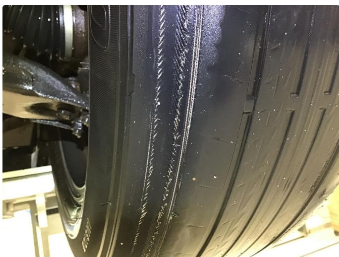
1.4 Dekkskade sommerhjul