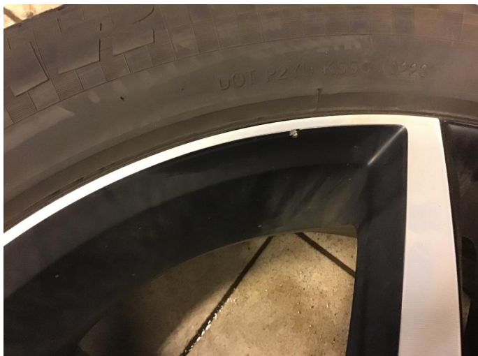
1.1 Skade på felg