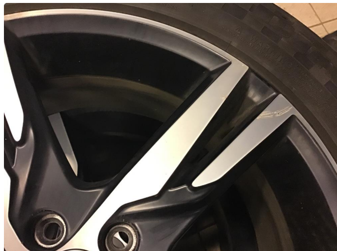
1.1 Skade på felg