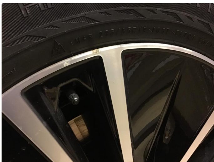
1.3 Kantkjørt felg