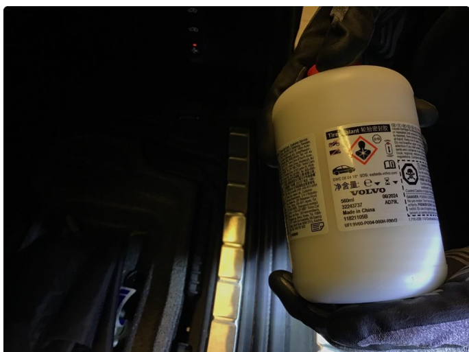
1.2 Øvrige feil