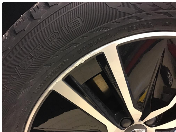
1.3 Kantkjørt felg