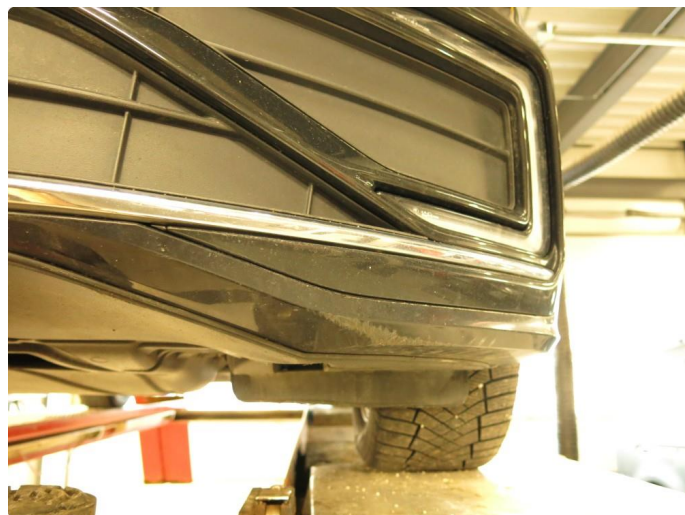
1.3 Skrubbekader underkant