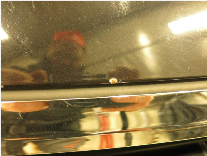
1.1 Noe steinsprut på panser - Penslet en del