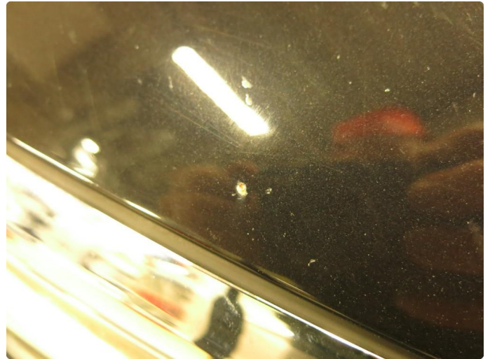
1.1 Noe steinsprut på panser - Penslet en del