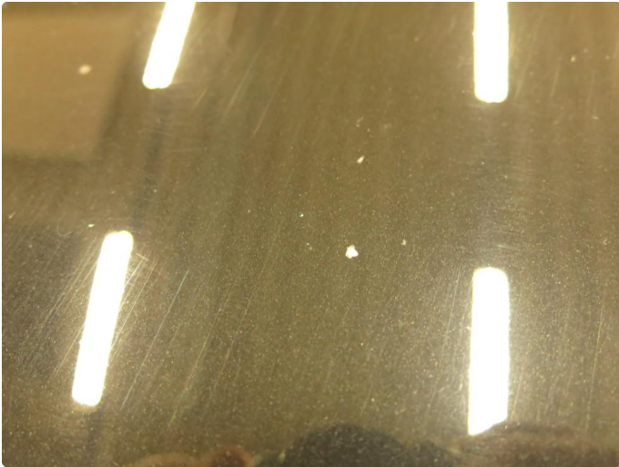
1.1 Noe steinsprut på panser - Penslet en del