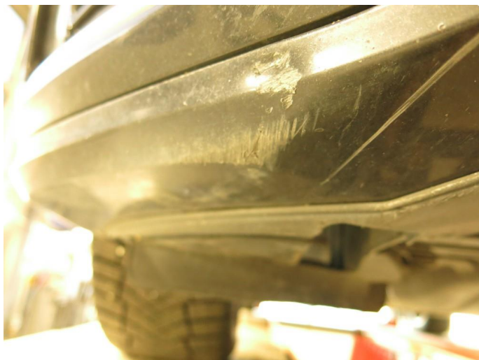
1.3 Skrubbekader underkant