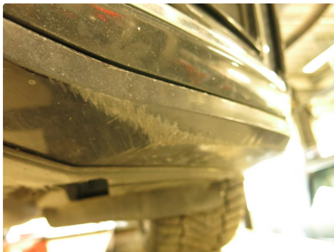
1.3 Skrubbskader underkant