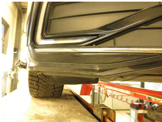
1.3 Skrubbskader underkant