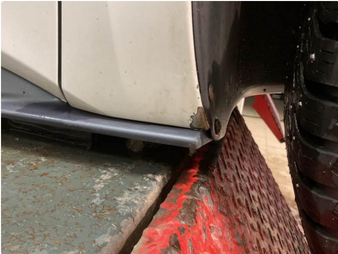
1.1 Noe lakkslitasje bakant hjul foran