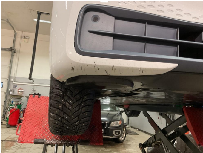
1.3 Skrubbskader underkant , vises ikke fra øverside