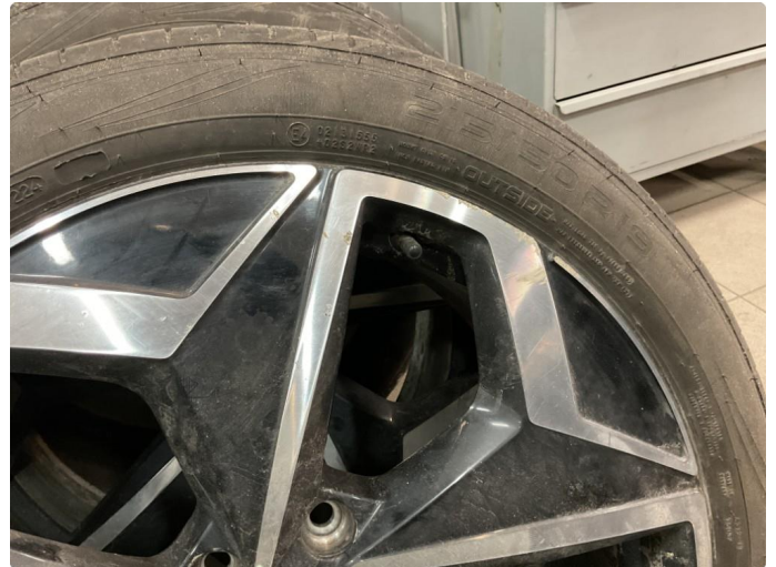
1.2 Noen små hakk i felg