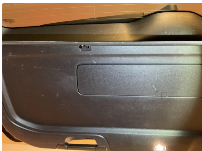
2.1 Bakluketrek innvendig noen riper