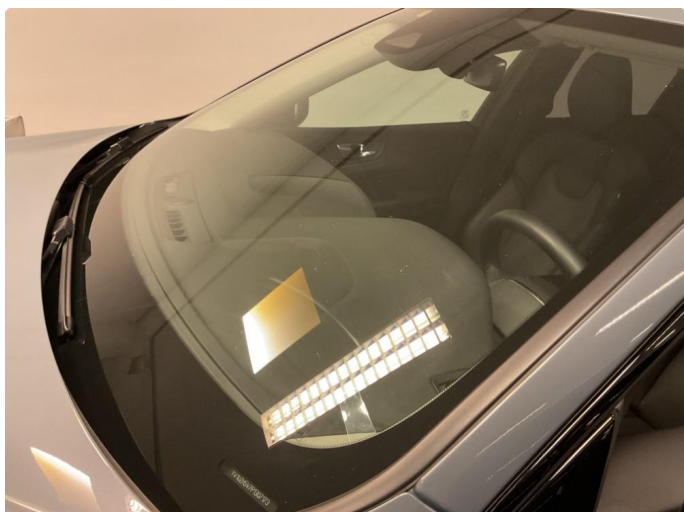
1.1 Steinsprut i synsfelt