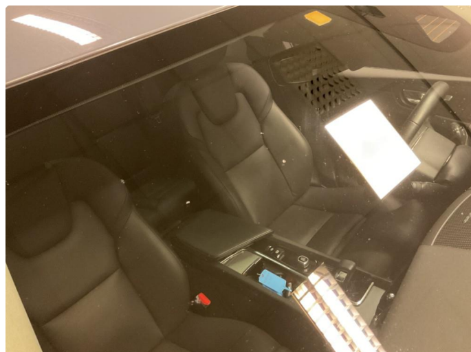
1.1 Steinsprut i synsfelt