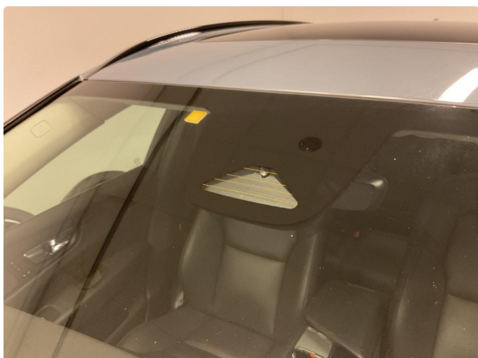
1.1 Steinsprut i synsfelt