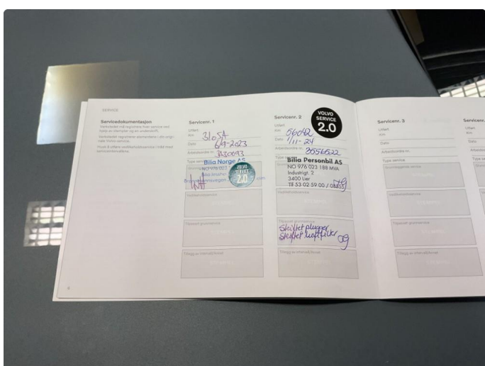
3.1 Dokumentert service, se bilde