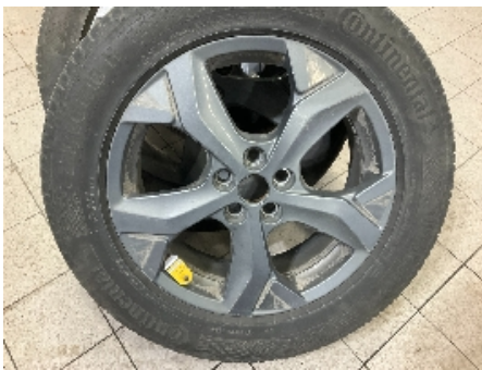
40. Ekstra hjulsett