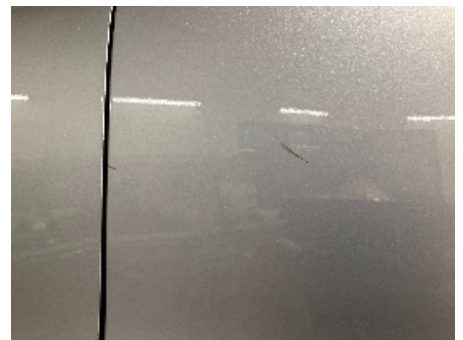
30. Lakk / karosseri utvendig