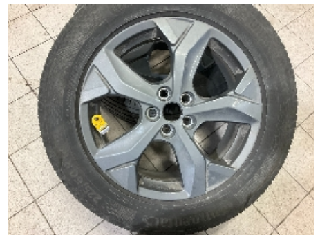
42. Ekstra hjulsett