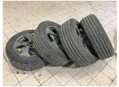
39. Ekstra hjulsett