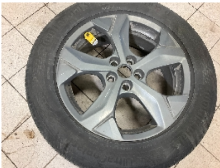
43. Ekstra hjulsett