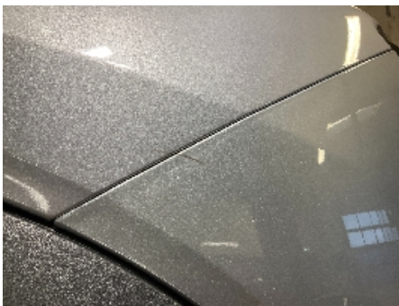
28. Lakk / karosseri utvendig