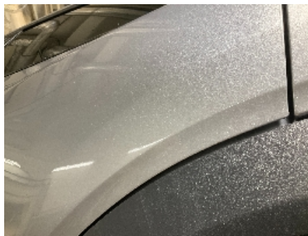
29. Lakk / karosseri utvendig