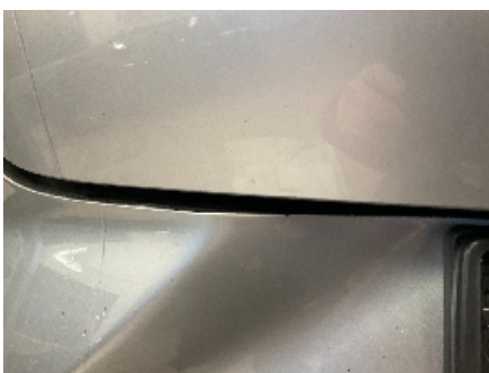
34. Lakk / karosseri utvendig