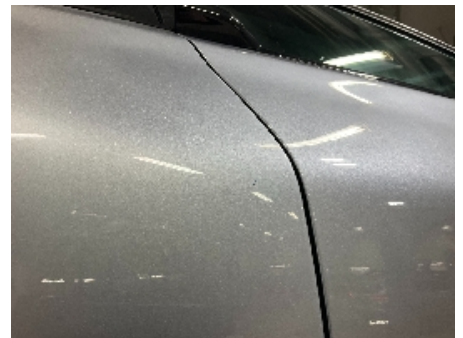
33. Lakk / karosseri utvendig