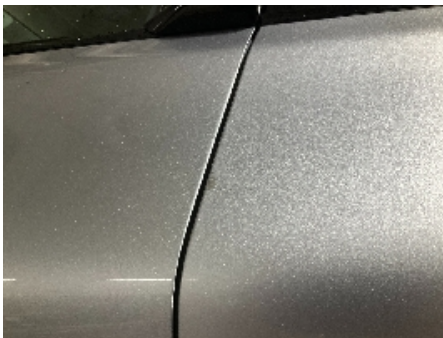
31. Lakk / karosseri utvendig