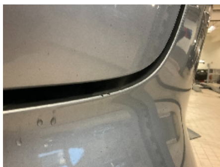
35. Lakk / karosseri utvendig