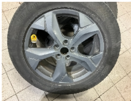
41. Ekstra hjulsett