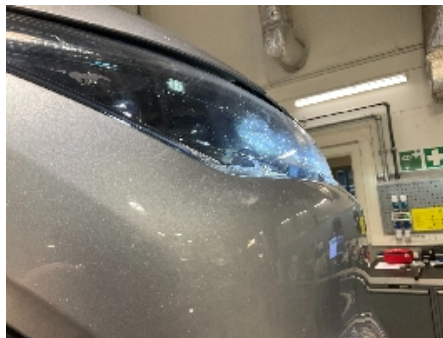
32. Lakk / karosseri utvendig