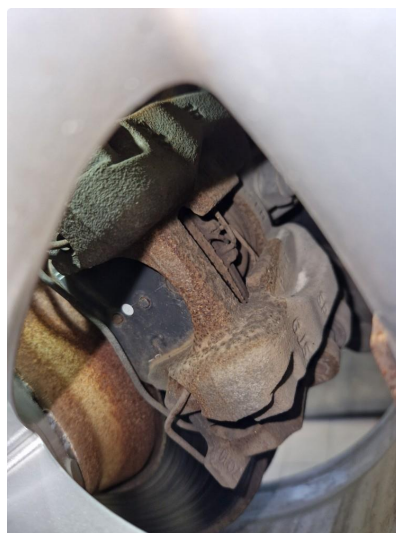
2.1 Utslitte klosser