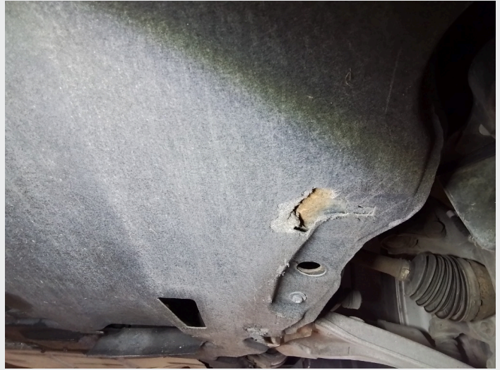
2.2 Slitte og skadede bukplater under motor og karosseri