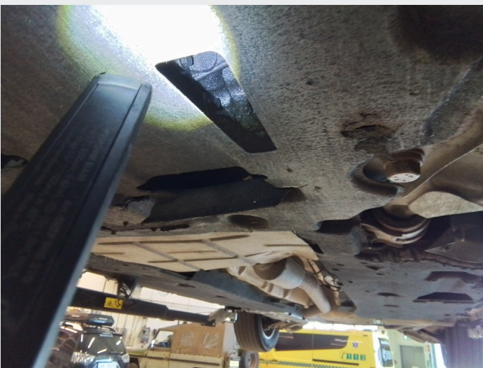
6.3 oljesvetting bakkant motor