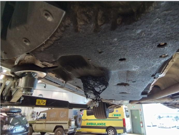
2.2 Slitte og skadede bukplater under motor og karosseri