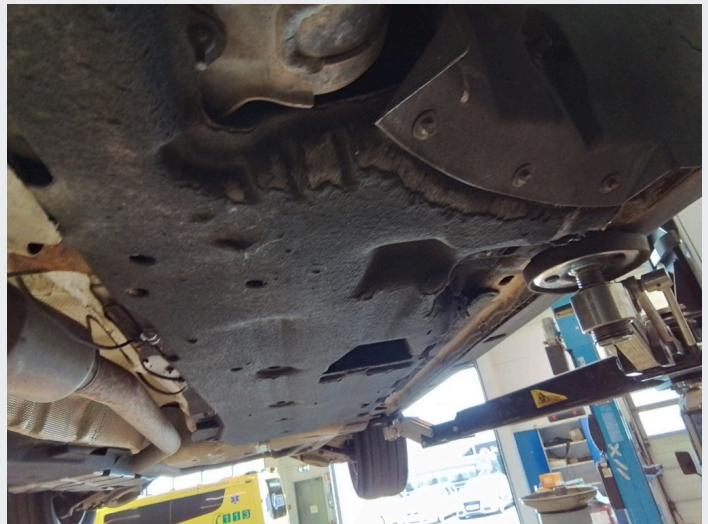
2.2 Slitte og skadede bukplater under motor og karosseri