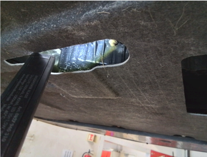
6.3 oljesvetting bakkant motor