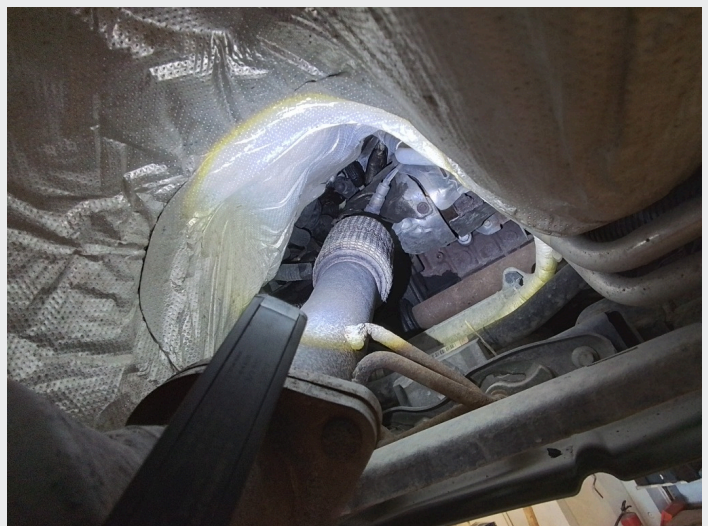
6.3 oljesvetting bakkant motor