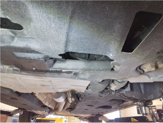
2.2 Slitte og skadede bukplater under motor og karosseri