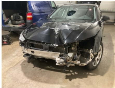
14. Lakk / karosseri utvendig