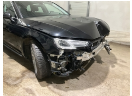
15. Lakk / karosseri utvendig