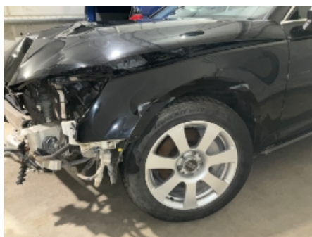
11. Lakk / karosseri utvendig