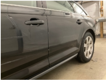
13. Lakk / karosseri utvendig