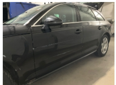
12. Lakk / karosseri utvendig