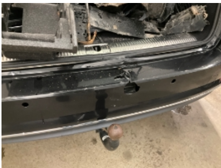
16. Lakk / karosseri utvendig