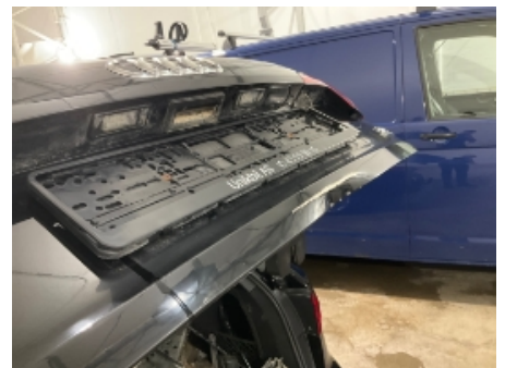
18. Lakk / karosseri utvendig