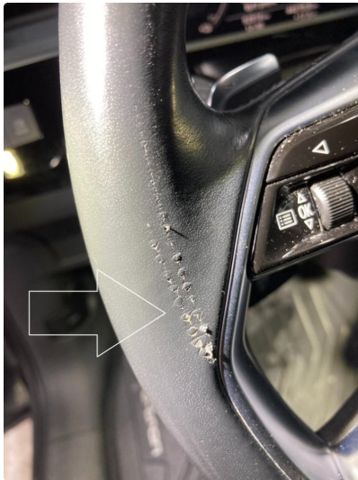
1.1 Riper på ratt