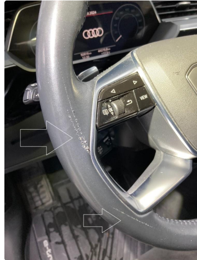
1.1 Riper på ratt