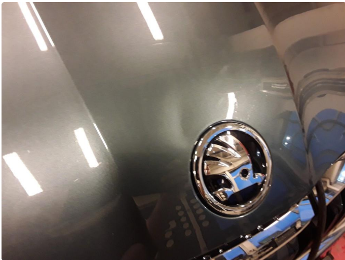
1.2 Liten bulk.