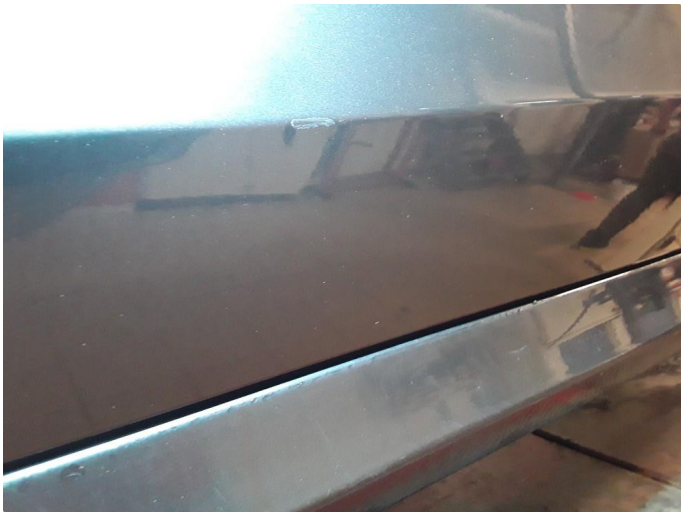
1.3 Liten bulk med lakksår.