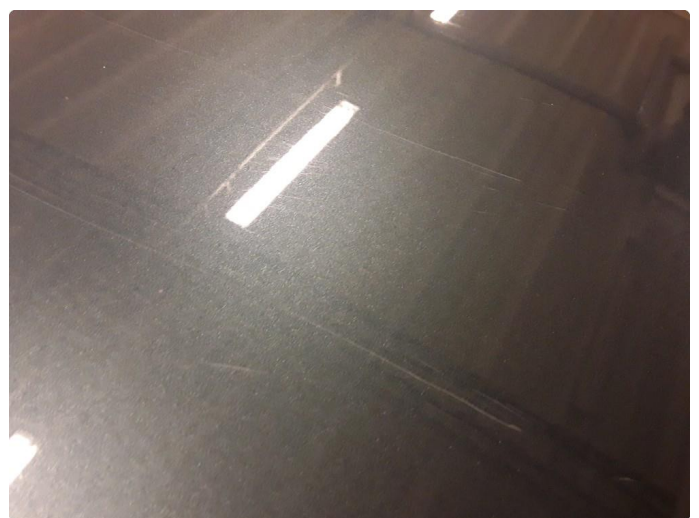
1.5 Noe steinsprut og riper.