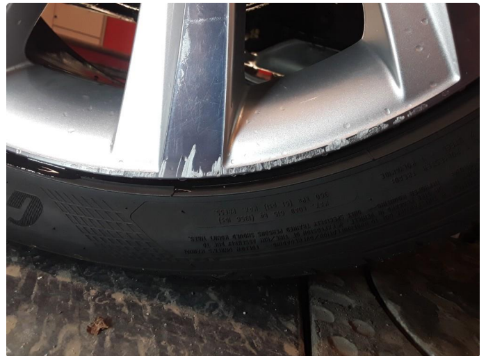
1.4 2 noe kantkjørte sommerfelger.