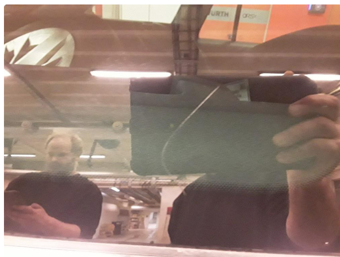
1.7 Noe riper.