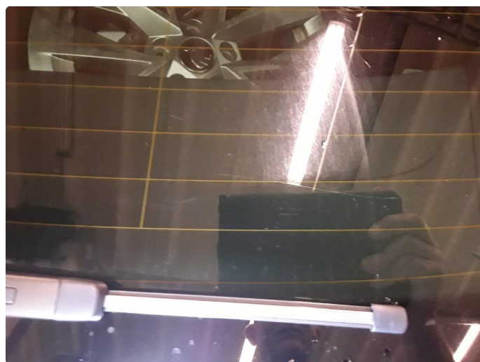
1.6 Noe riper.