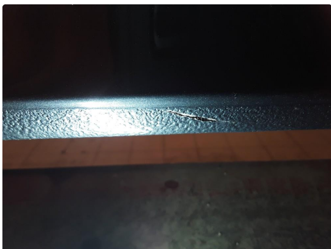
1.8 Liten ripe.