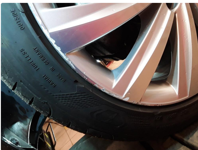
1.4 2 noe kantkjørte sommerfelger.