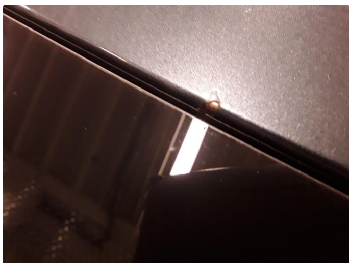
1.5 Noe steinsprut og riper.