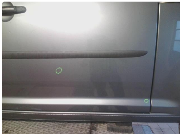
1.2 Steinsprut med rust