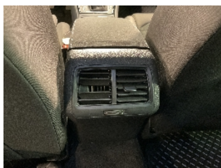
23. Luftdyse kupé