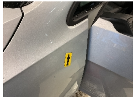
12. Lakk / karosseri utvendig