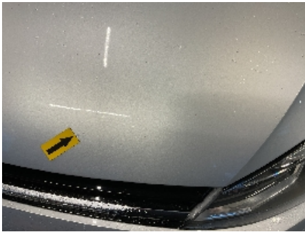
13. Lakk / karosseri utvendig