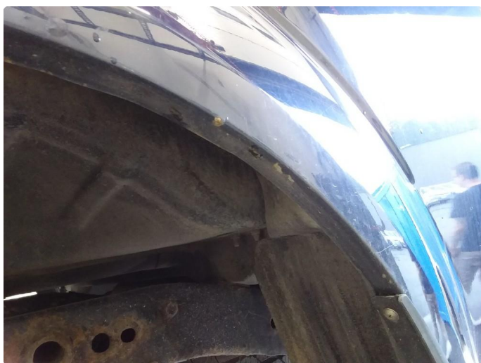
1.2 Lett rust