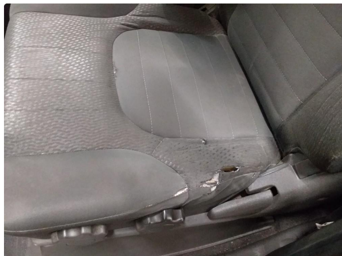
2.1 Skade på setetrekk