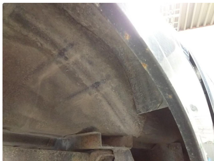
1.2 Lett rust