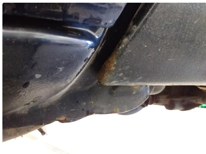
1.2 Lett rust