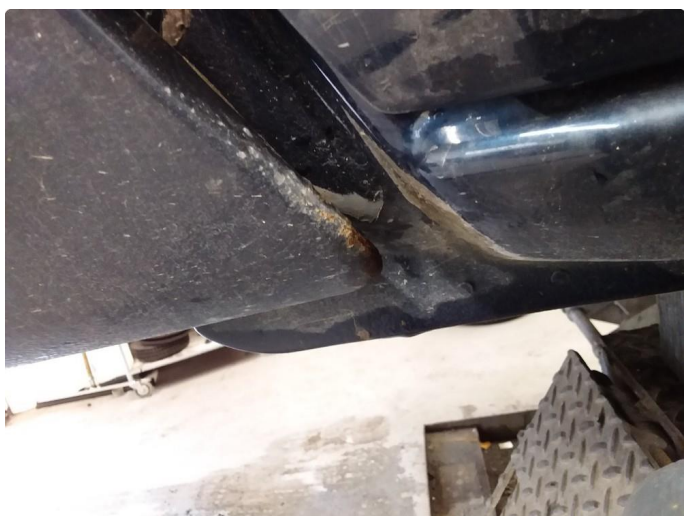
1.2 Lett rust