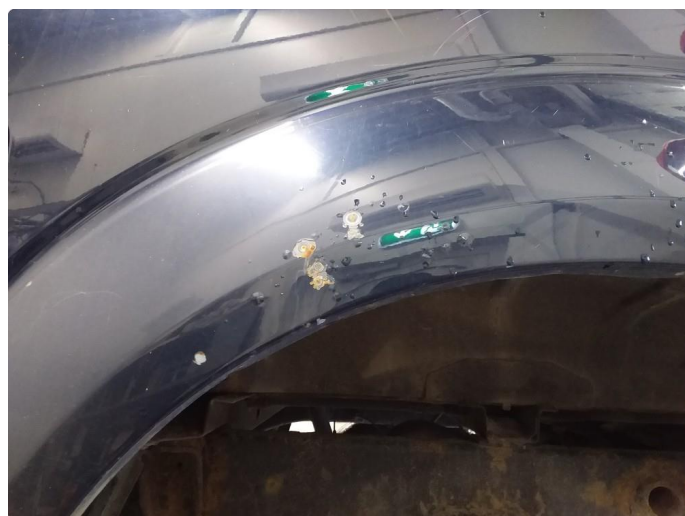
1.2 Lett rust