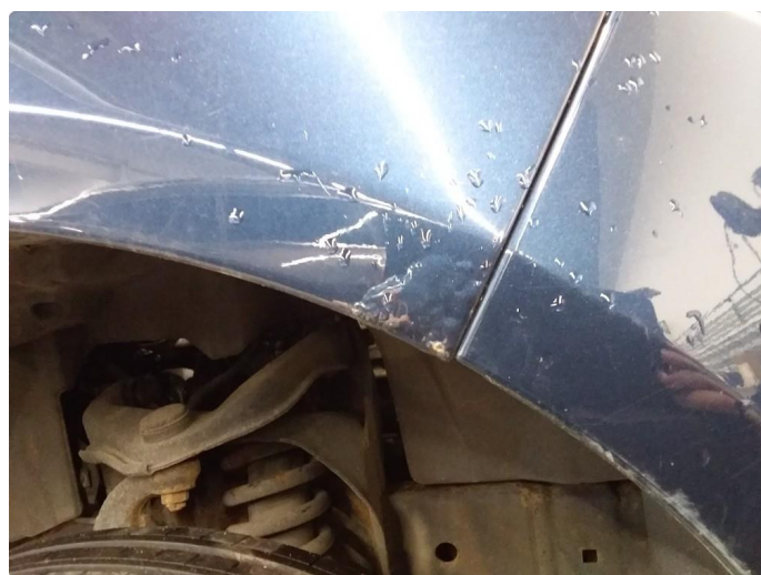
1.2 Lett rust