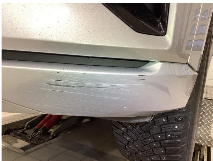
1.3 Bestilt Rep.