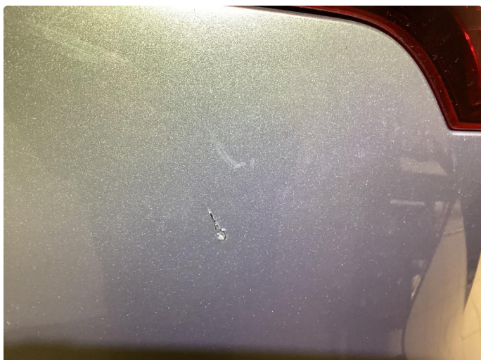
1.1 Bruks merker