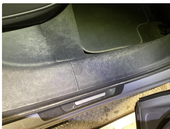
2.2 Normal bruks merker