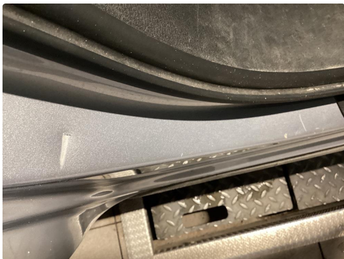
2.3 Bruks merker