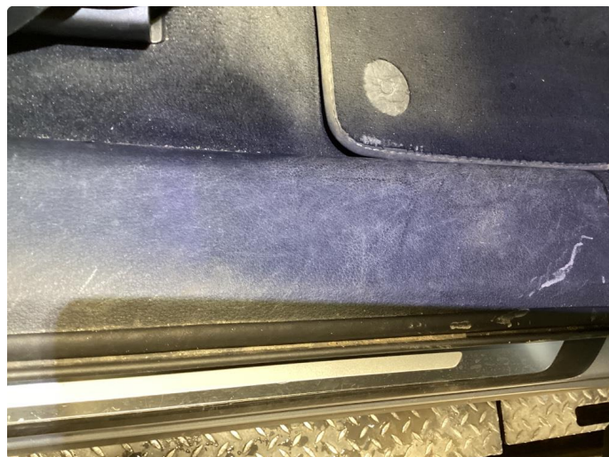
2.4 Normal bruks merker