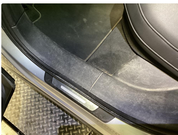
2.1 Normal bruks merker