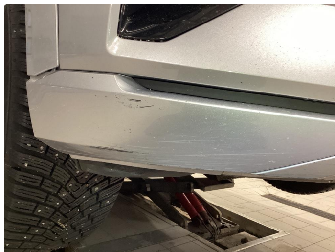
1.3 Bestilt Rep.