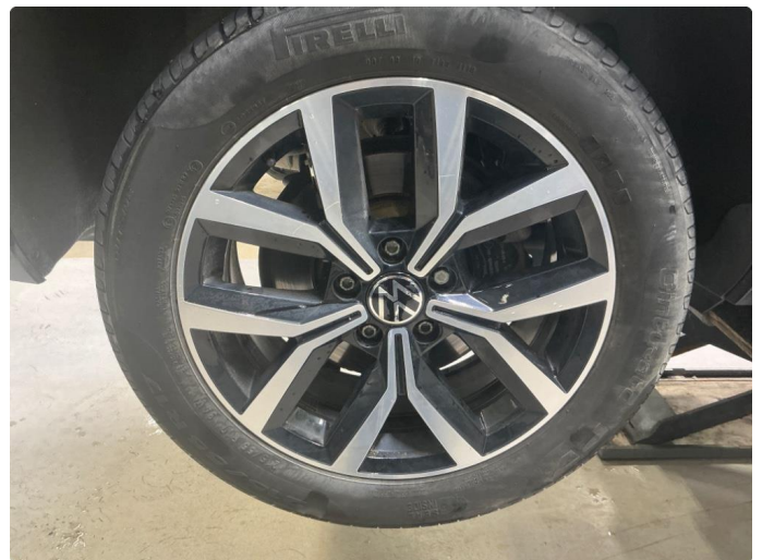
1.5 Riper sommerfelger