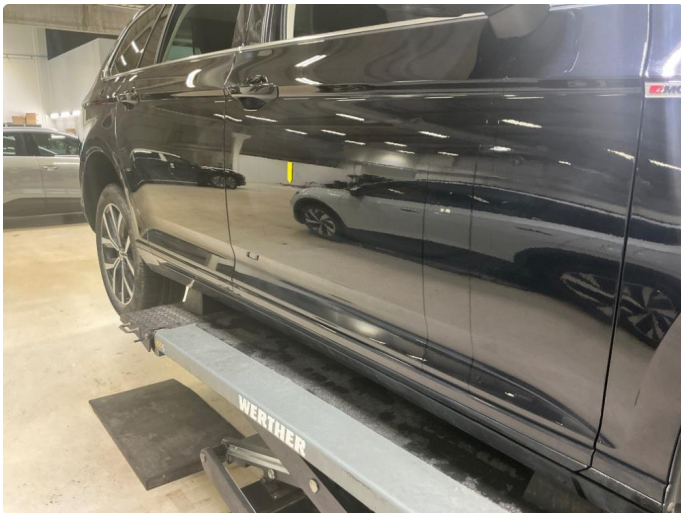
1.2 P-bulk h.fordør