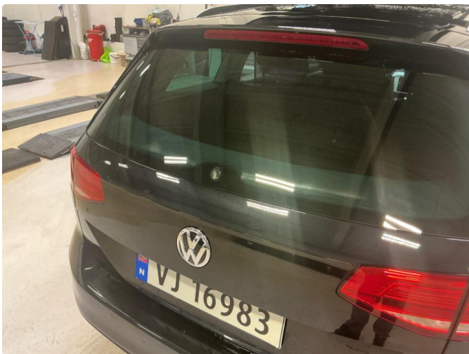
1.4 Slitt bakrute etter visker.