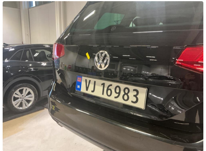
1.3 Bulk bakluke.