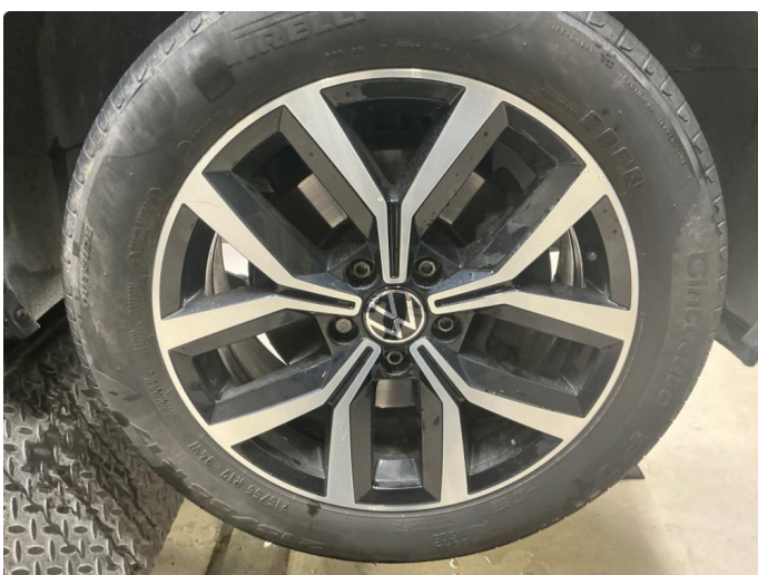
1.5 Riper sommerfelger