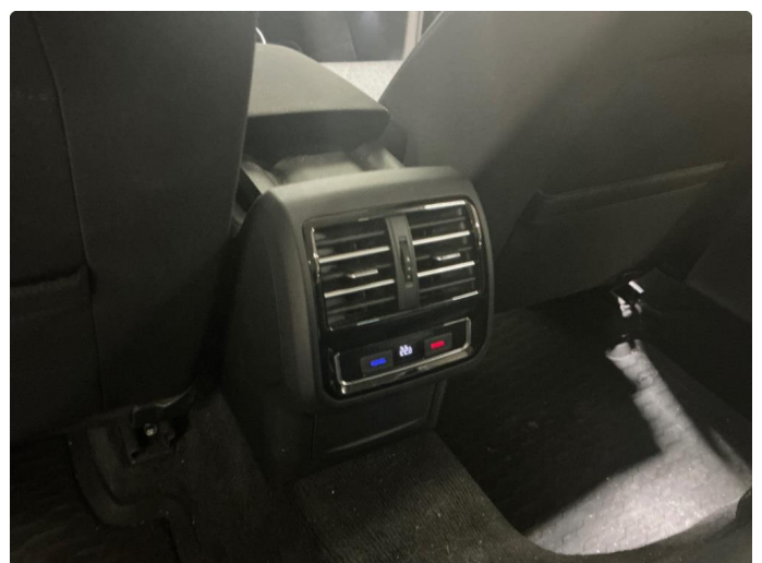
2.1 Midtkonsoll bak , skadet luftventil