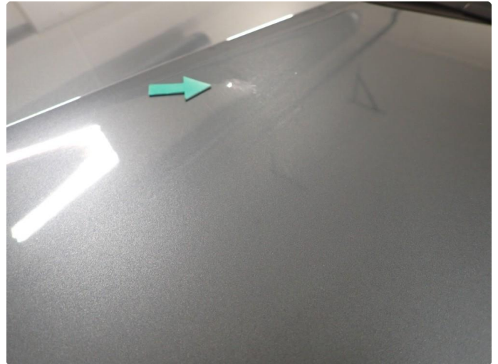
1.1 2 steinsprut med lakkskade