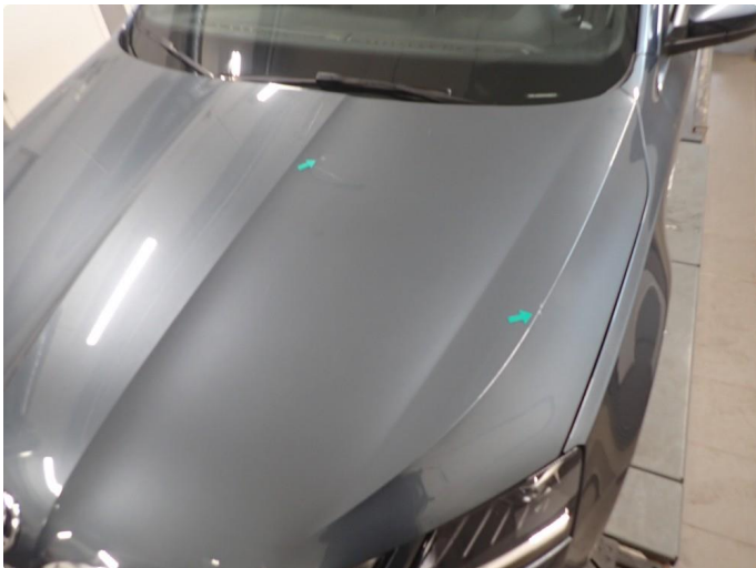
1.1 2 steinsprut med lakkskade