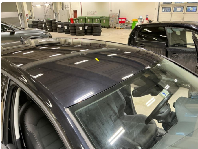
1.8 Rustflekk på tak.