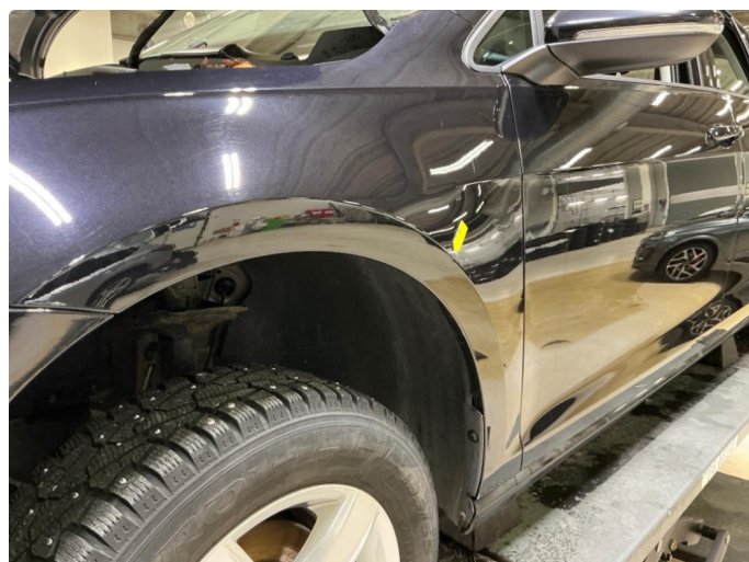
1.4 Liten bulk v.forskjerm