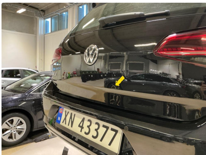
1.3 Flere småbulker på bakluke.