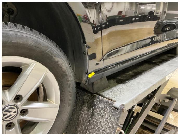
1.9 Rust kanal v.side.