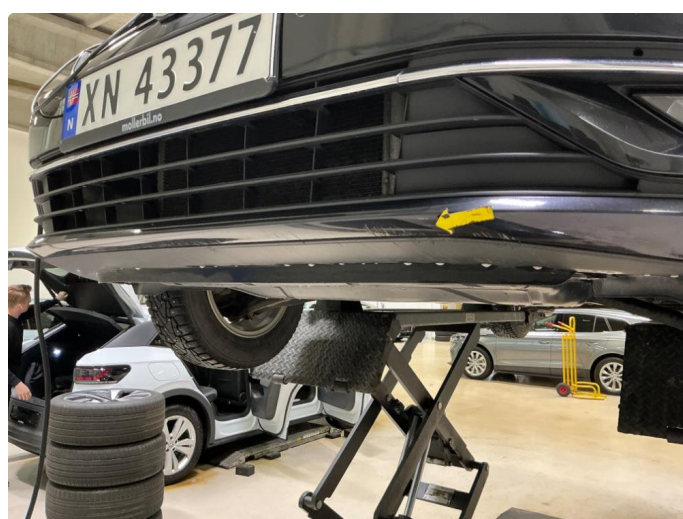
1.7 Riper undersiden fanger foran.