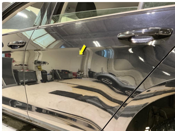
1.2 Ripe v.bakdoor.