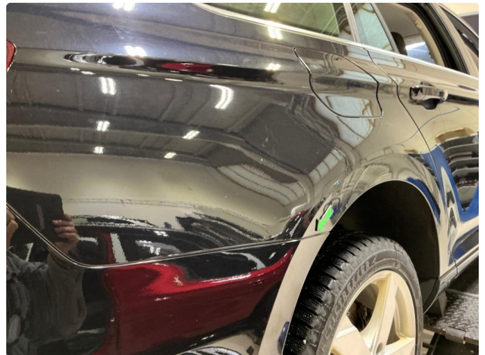
1.3 Lakkblærer begge bakskjermene.