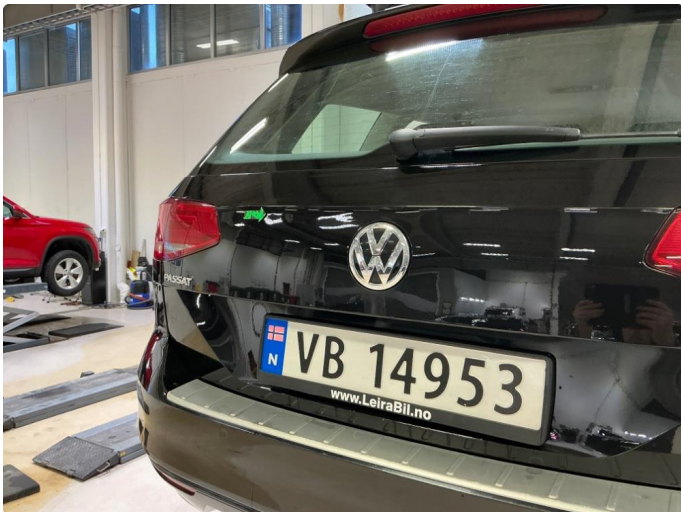
1.2 Noen små bulker på bakluke