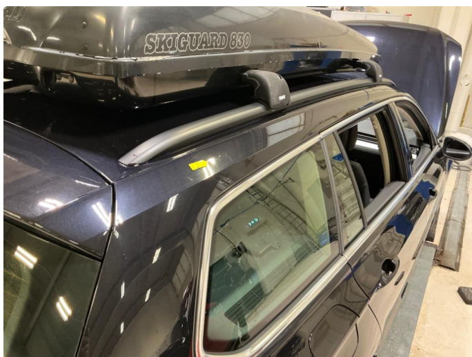
1.6 Liten bulk h.takvange.