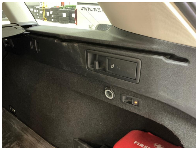
3.1 Øvrige feil