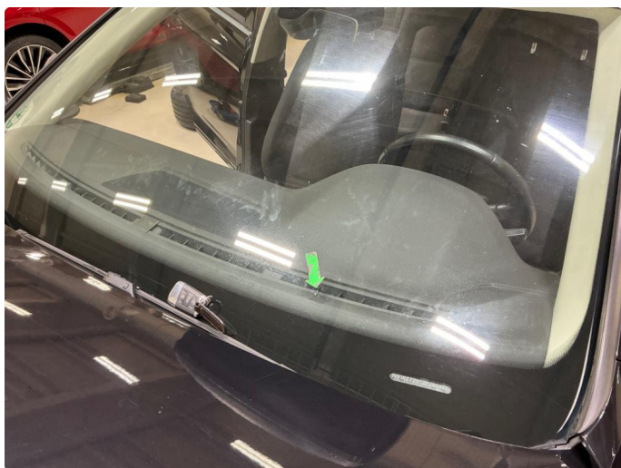
1.7 Frontrute slitt etter visker. Steinsprut nedre del frontrute.