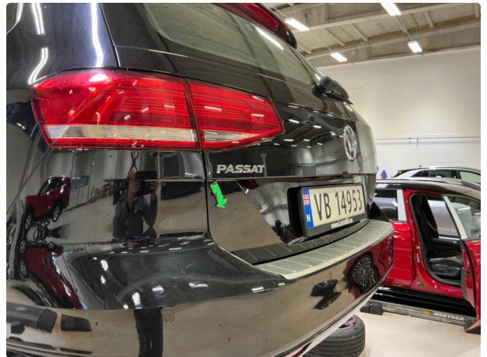
1.2 Noen små bulker på bakluke