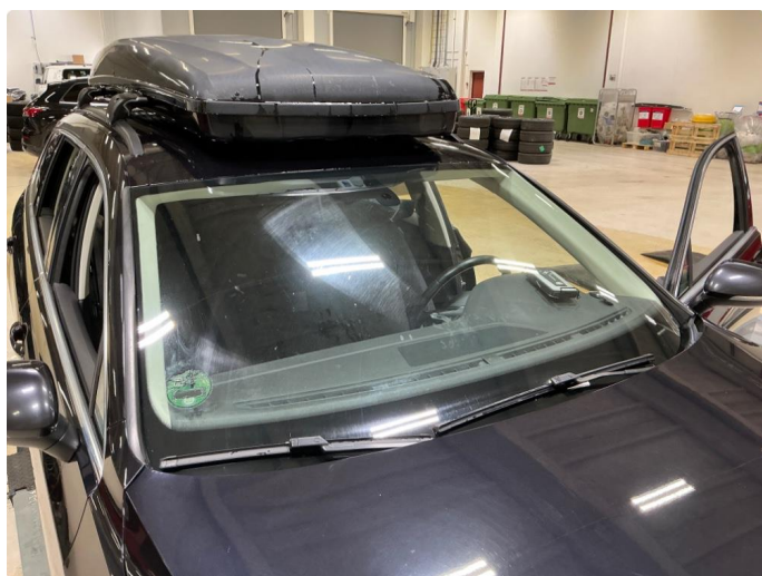
1.7 Frontrute slitt etter visker. Steinsprut nedre del frontrute.