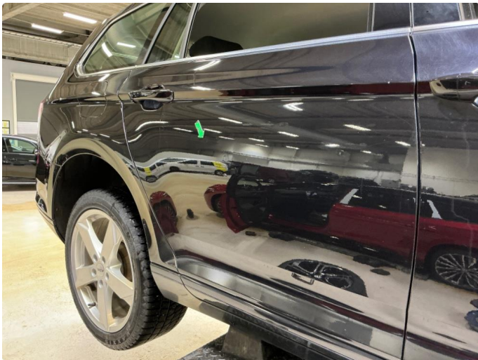
1.1 2 små bulker h.bakdør