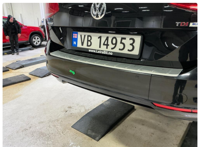
1.5 Bulk + noen riper fanger bak.