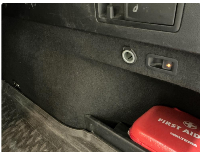
3.2 Defekt 12 v uttak i bagasjerom.