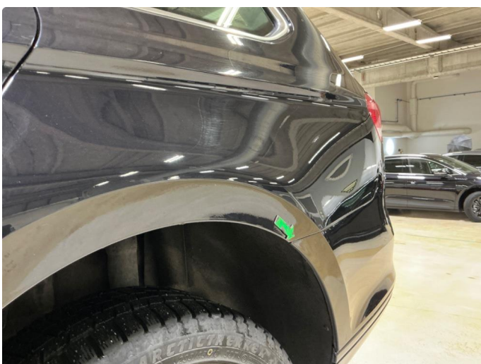
1.3 Lakkblærer begge bakskjermene.