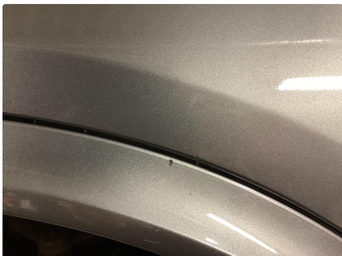
1.1 Lett ripe vestre forskjerm (poleres)