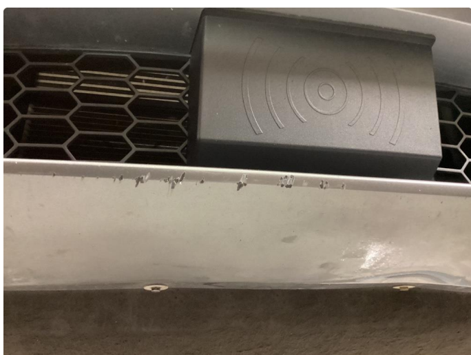
1.3 Skade liten under fanger (normalt etter bilens alder)