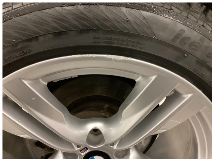
1.2 Småskade på vinterfelgerfelg (lett Normalt etter bilens alder)