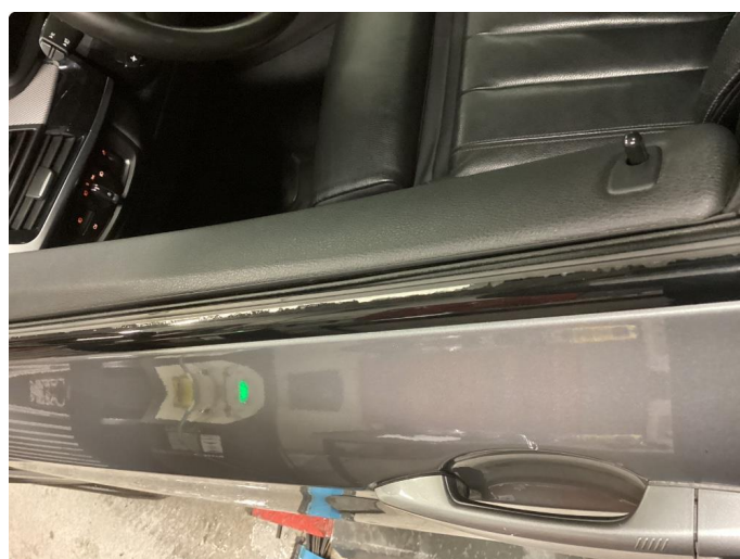
1.4 Øvrige feil