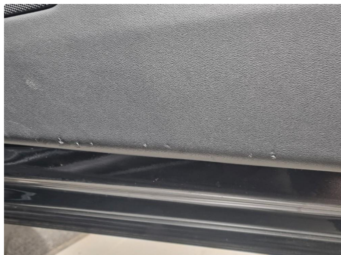
3.1 Noen rift/hakk nederst på dørtrekk