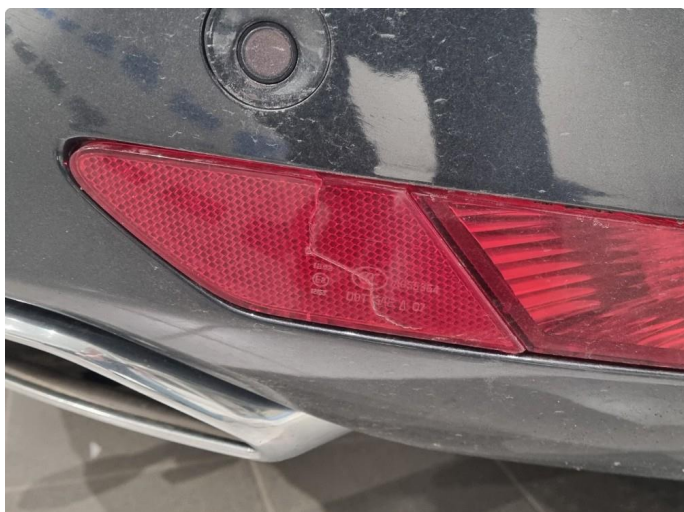
2.1 Sprekk i refleks