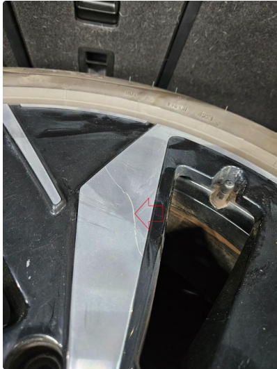
1.1 Ripe på en sommerfelg